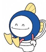
下水道マスコットキャラクター 「スイスイ」

既に公共下水道が完成し、汚水処理が可能となっている地区にお住まいの場合、まだ公共下水道に接続していない方につきましては、早急に接続をお願いします。（接続可能かどうかご不明な場合は、上下水道課へお問い合わせください。）