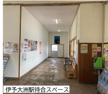
伊予大洲駅待合スペース

【指定管理施設管理経費】工事請負費 1,752千円 鹿野川荘の敷地内で小崩落が発生した自然法面の安全性を確保するため、モルタル吹付保護工事を実施します。(モルタル吹付工 A=60㎡)