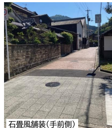
石畳風舗装(手前側)