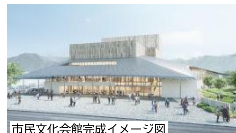
市民文化会館完成イメージ図

再生可能エネルギー設備設計業務等委託料 19,668千円 報償費 156千円, 費用弁償 60千円 再生可能エネルギー導入に関する実現可能性調査の結果を踏まえて、オフサイト発電の手法により、大洲城などの観光施設へ電力供給を行う太陽光発電設備を整備する(市営住宅跡地:太郎宮区)ための詳細設計などを行います。