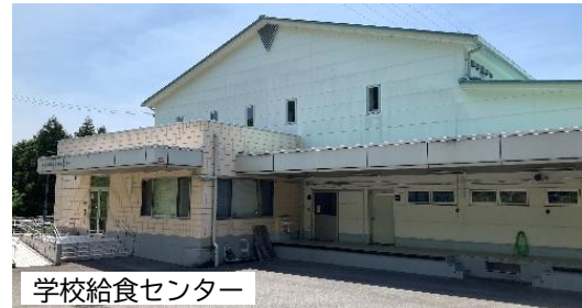
学校給食センター