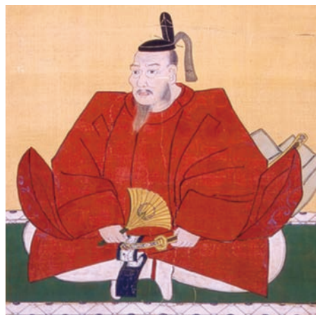
加藤光泰肖像画(龍護山曹溪院蔵)