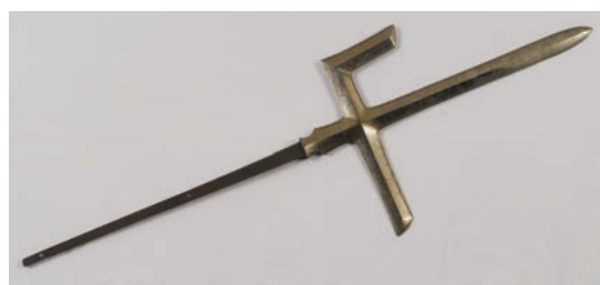
光泰愛用の「片鎌槍」の模品(当館蔵)