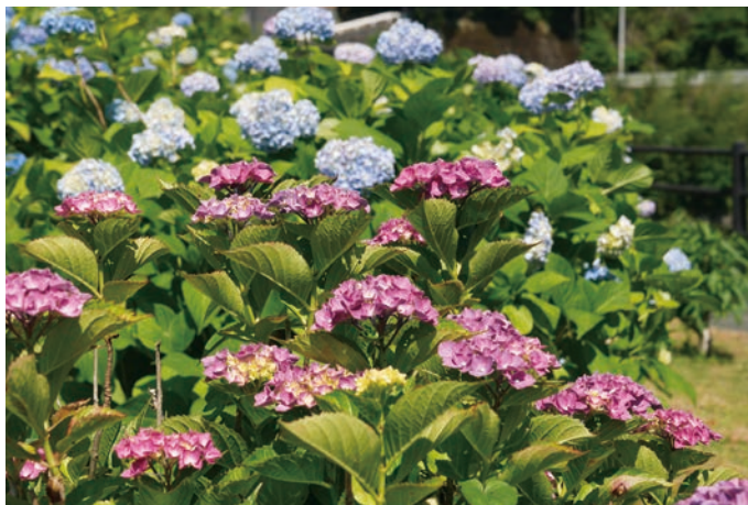
道の駅のアジサイ（肱川町宇和川） 6月1日(月)撮影