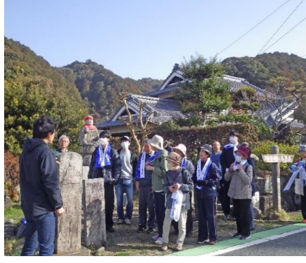
伊予遍路道大寶寺道で行われた 「おもてなしへんろ道ウォーク」 (令和8年2月23日)