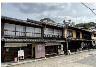
空き家となった古民家を改修活用した店舗・宿泊施設