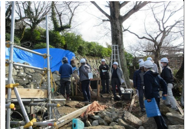
石垣修復委員会 現地視察の様子 (令和8年2月)