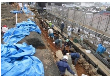
改修中の大洲城の石垣