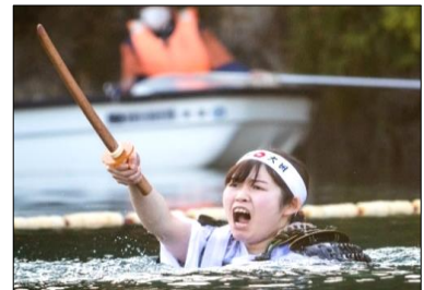
県指定無形文化財「大洲神伝流泳法」