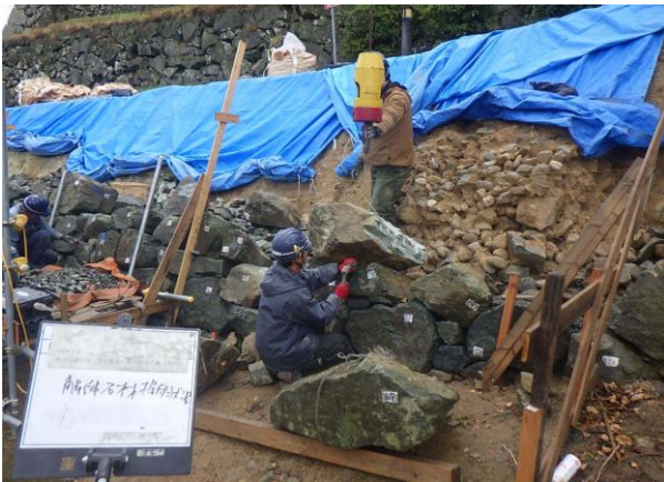
石垣の積直し状況 (令和8年1月)