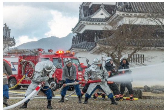
県史跡「大洲城跡」での消防訓練の様子 (令和8年1月25日)