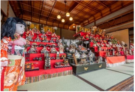
末永家住宅百帖座敷での雛飾り展示 (令和7年3月1日～4月13日)