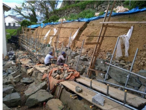
石垣D-1箇所の石垣積み直し作業の様子 (令和7年10月25日)