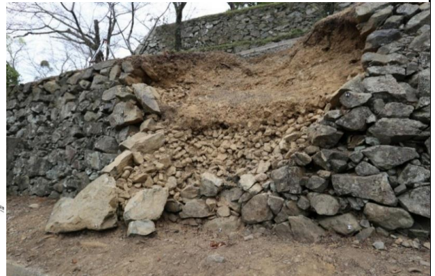
令和5年6月に崩壊した石垣D-1箇所の状況 (令和5年9月)