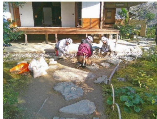
国名勝「臥龍山荘庭園」整備の様子 (令和8年1月30日)