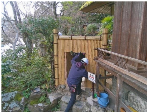
国名勝「臥龍山荘庭園」路次門修理の様子 (令和8年1月20日)