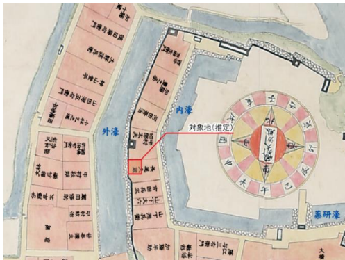
寛政11年大洲城下絵図にみる 「大洲城外堀石垣」試掘地点