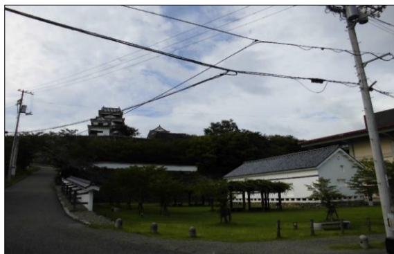
地下埋設予定電線 ①