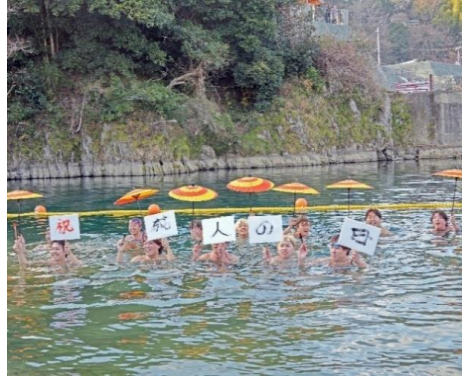
肱川で行われた「大洲市寒中水泳大会」 (令和8年1月12日)