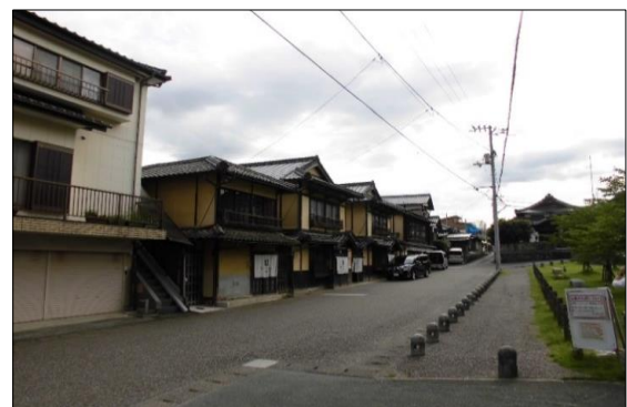
地下埋設予定電線 ②