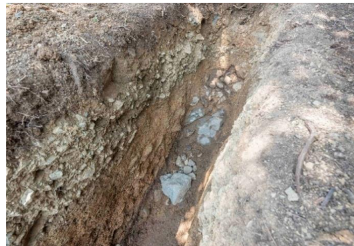
検出した外堀石垣の背面構造 (令和7年7月16日)