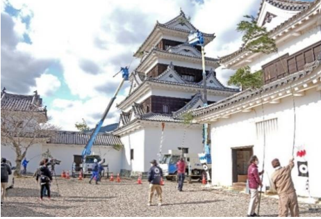
大洲城での文化財ボランティア清掃活動 (令和7年12月12日)