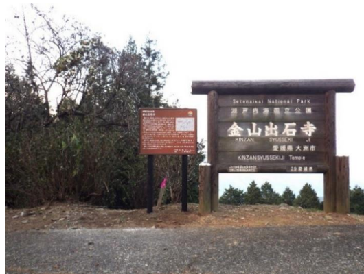
県名勝「金山出石寺」説明板整備 (令和7年12月8日)