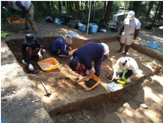
村島宮の首遺跡親子発掘体験会 (令和7年8月2日)