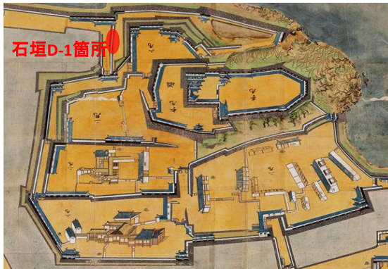
元禄絵図にみる石垣D-1箇所