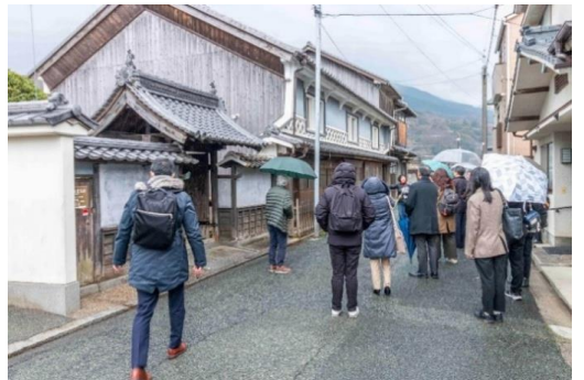
長浜地区モニターツアー (令和8年1月24日、25日)