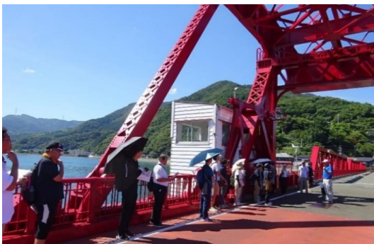
小学校社会科及び総合的な学習の時間班会 夏季研修会(令和7年7月30日)