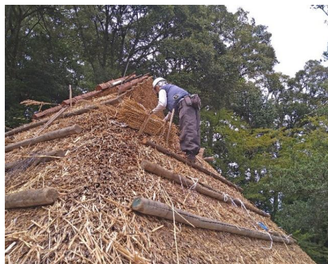
国重文「臥龍山荘 不老庵」屋根葺替の様子 (令和7年9月18日)