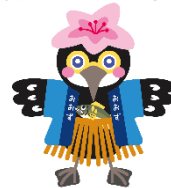
大洲市公式キャラクター「うつつじ」