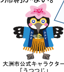
大洲市公式キャラクター「うつつじ」

市内対象世帯のみ、新築のために登録物件を購入する場合も補助対象になります。大洲市空き家バンクに登録された物件(100万円以上)を購入し、成約後1年以内にその土地に新築し、居住する場合はこの補助制度の対象となります。