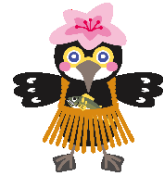
市公式キャラクター「うつつじ」