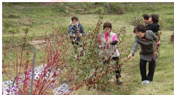
↑いきいきネットワーク視察研修の様様(東温市にて)

いま全国において農業委員会にもっと女性を登用しようという目標が掲げられています。大洲市は全委員中の女性委員の割合が15.4%で、愛媛県内の農業委員会では比較的高い割合となっています。