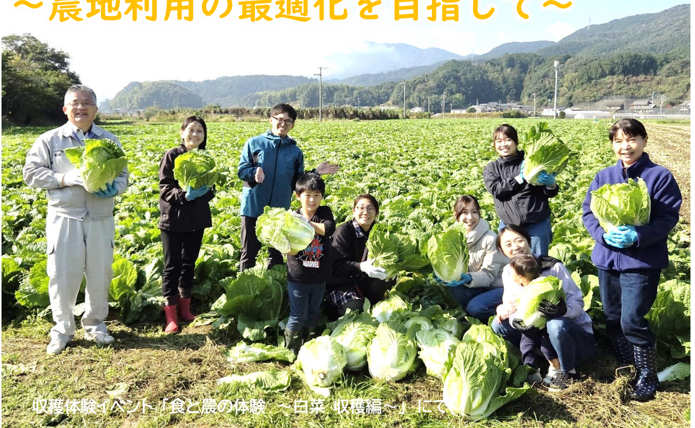
収穫体験イベント「食と農の体験 ～白菜 収穫編～」にて