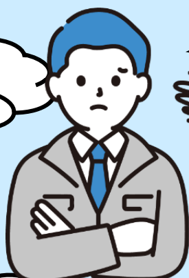
農地を貸したい人