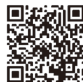
タックスアンサー