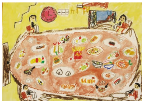
▷絵画の部 5歳児部門