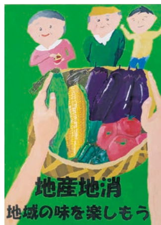
▷ポスターの部 中学校部門