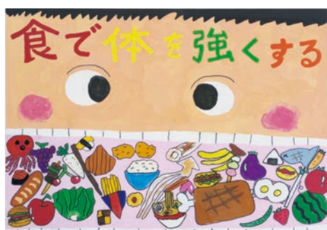
▷ポスターの部 小学校中学年部門