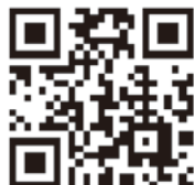
確定申告書等 作成コーナー