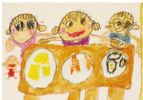
▷絵画の部 4歳児部門