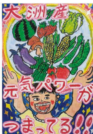
▷ポスターの部 小学校高学年部門