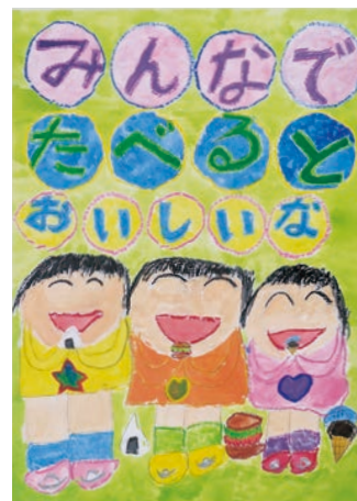
▷ポスターの部 小学校低学年部門