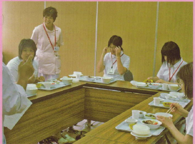
「見て・体験して・感じて、看護の思い」ふれあい看護体験の様子 (H23.5.13)