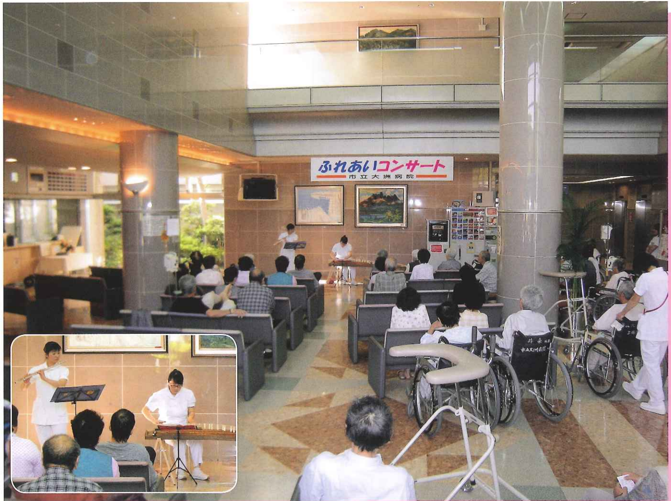
第13回 院内ふれあいコンサート (H22. 5.14) フルート：畠山夏子看護師、琴：森嶋香菜看護師

発行：市立大洲病院 編集：市立大洲病院 広報委員会 〒795-8501 大洲市西大洲甲570番地 TEL0893-24-2151 FAX0893-24-0036