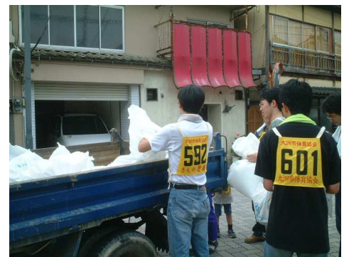
三の丸附近でゴミ拾いをする当院職員

今回、当院の参加者は、肱南・大洲城コースに参加をし、投げ捨てられたタバコの吸い殻や空き缶・空きビンなどの回収を行い、合せて大洲の町並み・風景を再確認しました。