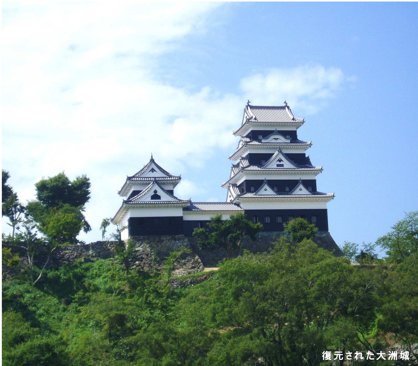
復元された大洲城

発行：市立大洲病院 編集：市立大洲病院 広報委員会 〒795-8501 大洲市西大洲甲570番地 0893-24-2151 fax0893-24-0036