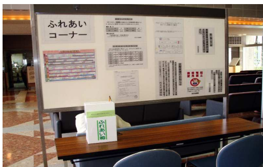
1 階ロビー（中央待合室）

みなさまの病院に対するご意見、ご提言等をお気軽にお寄せいただく方法として、1 階ロビー（中央待合室）、各病棟のデイルームに「ふれあい箱」を設置しています。 みなさまのいろいろな声をもとに、患者様に選ばれる病院を目指してまいります。