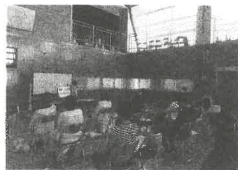
【菅田小学校就学時健診】