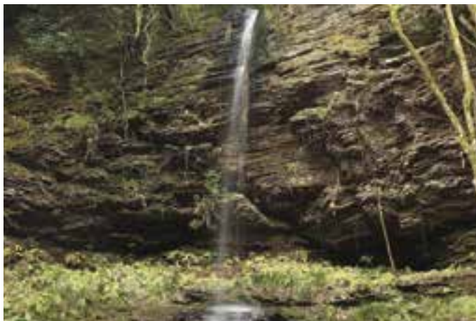
赤子の滝（河辺町川崎）3月23日出撮影