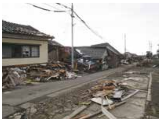
被害の大きい珠洲市内

今後、発生する恐れのある南海トラフ巨大地震では、大洲市でも震度7の揺れが生じる想定であるため、今回の地震については、誰もが自分に置き換えて対策を考えていく必要があると思います。