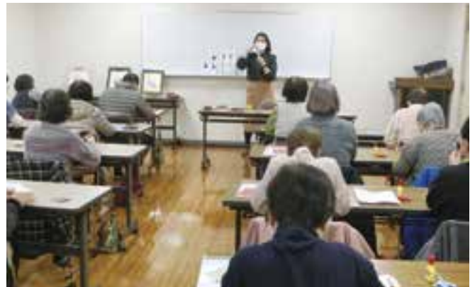
学級講座「折り紙教室」の様子