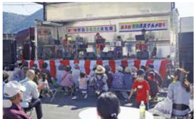
地域づくり活動「ふるさとまつり」の様子

身近な地域資源を利用した活動などに参加することは、地域の人々と触れ合う貴重な機会でもあり、子供の社会性を育む上でも大きなメリットがあります。