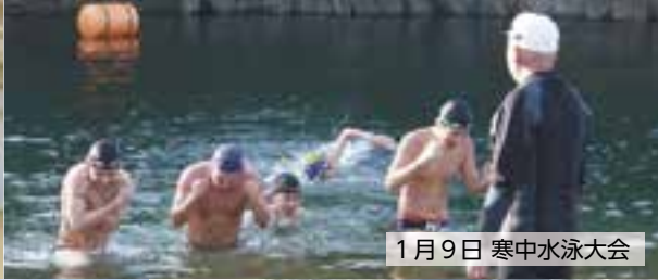
1月9日 寒中水泳大会