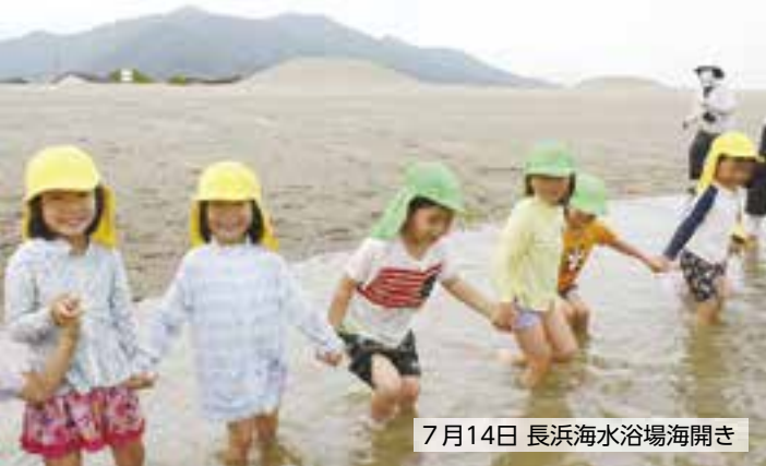
7月14日 長浜海水浴場海開き