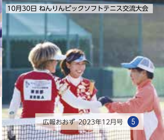
10月30日 ねんりんピックソフトテニス交流大会