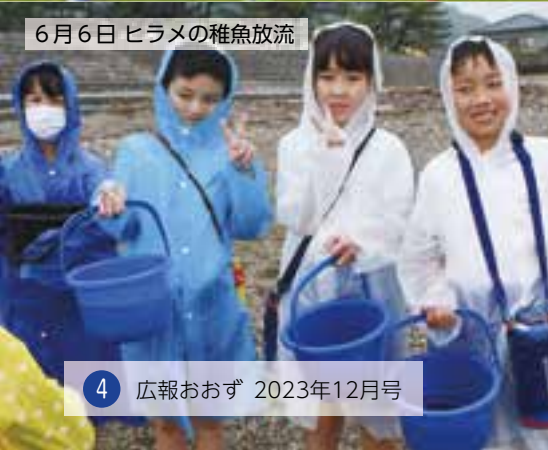
6月6日 ヒラメの稚魚放流