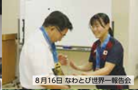
8月16日 なわとび世界一報告会