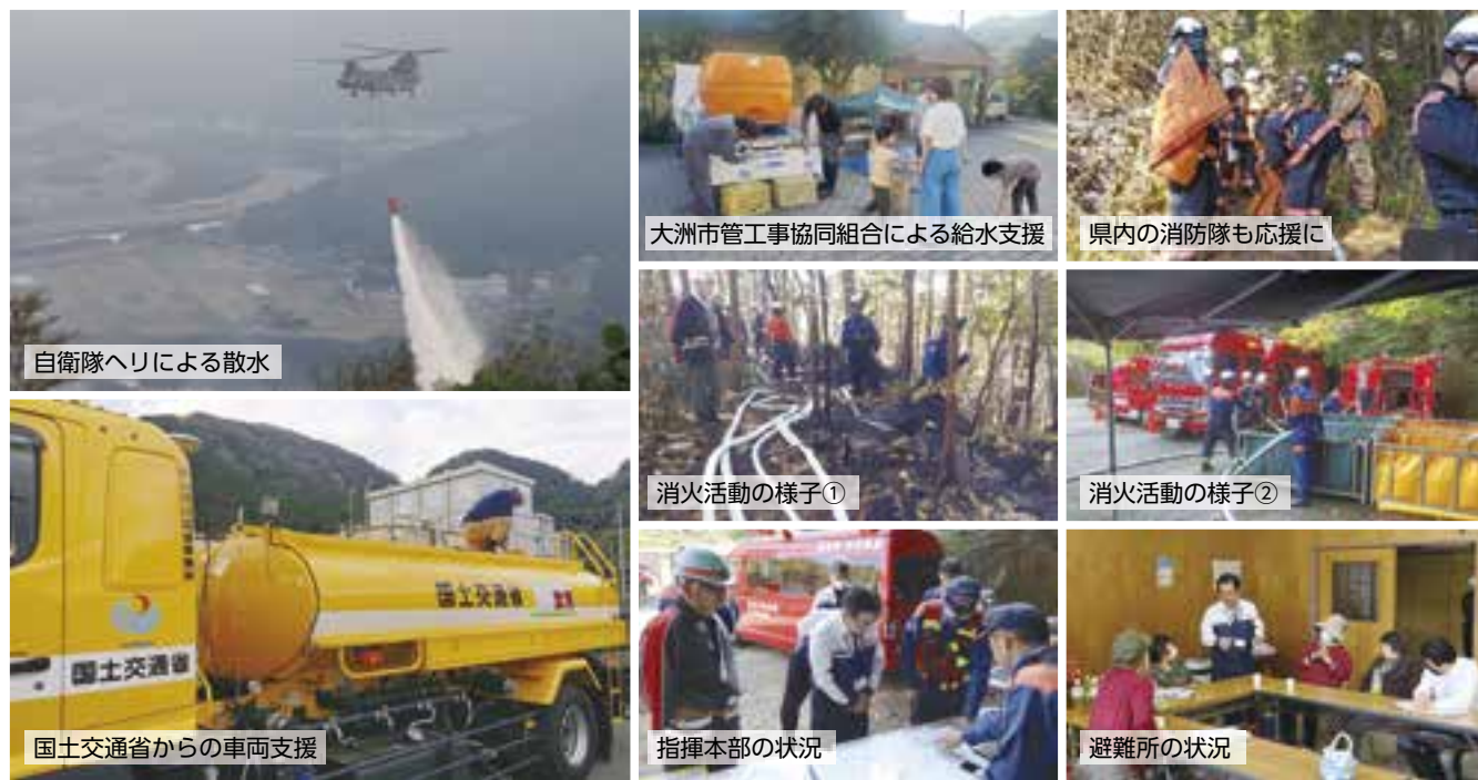
自衛隊ヘリによる散水