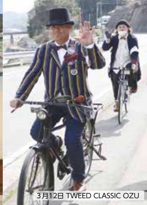
3月12日 TWEED CLASSIC OZU