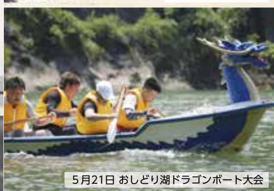
5月21日 おしどり湖ドラゴンボート大会