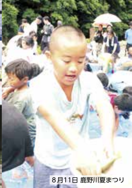
8月11日 鹿野川夏まつり