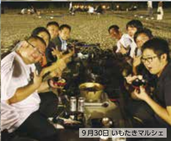
9月30日 いもたきマルシェ