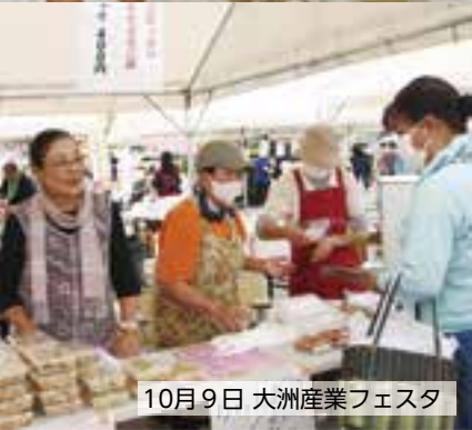
10月9日 大洲産業フェスタ