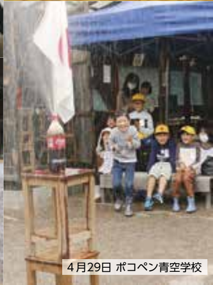
4月29日 ポコペン青空学校