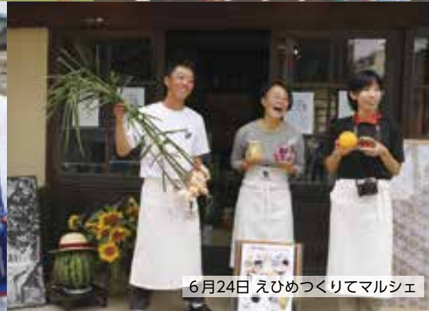
6月24日 えひめつくりてマルシェ