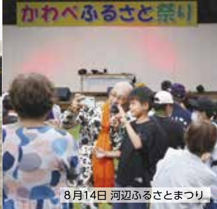
8月14日 河辺ふるさとまつり