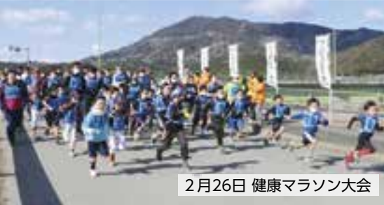
2月26日 健康マラソン大会