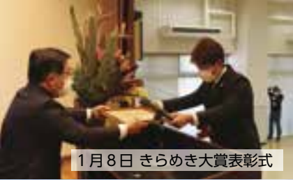
1月8日 きらめき大賞表彰式