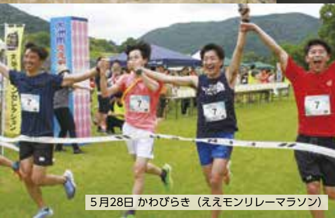
5月28日 かわびらき (ええモンリレーマラソン)