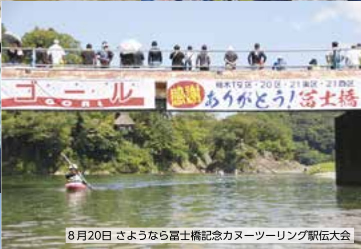
8月20日 さようなら富士橋記念カヌーツーリング駅伝大会