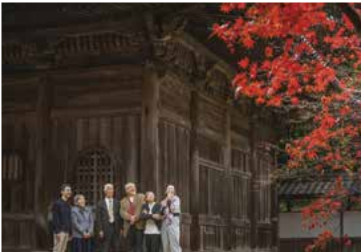
Asia WPA International Photography Competition受賞作品

家族の形を写真に収めることで、みなさんが家族を見つめ直す、そして家族の絆がより深まるきっかけになればいいなと願っています。