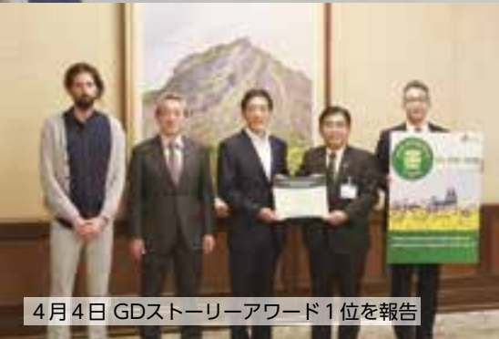
4月4日 GDストーリーアワード1位を報告