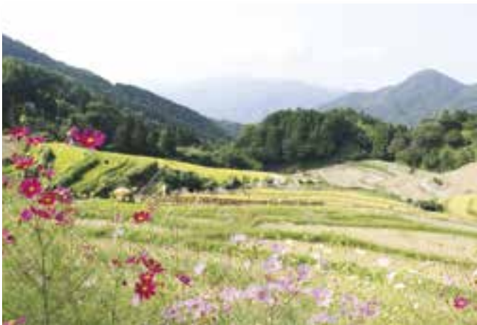
榎谷の棚田（9月30日出撮影）