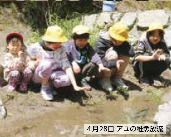
4月28日 アユの稚魚放流