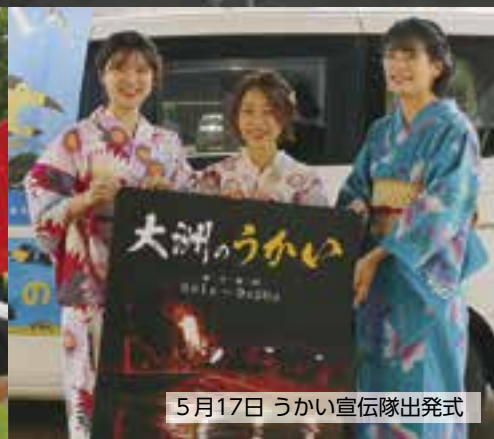
5月17日 うかい宣伝隊出発式