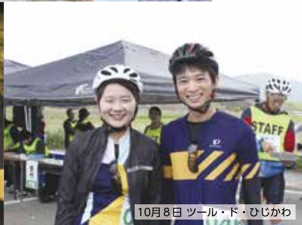
10月8日 ツール・ド・ひじかわ