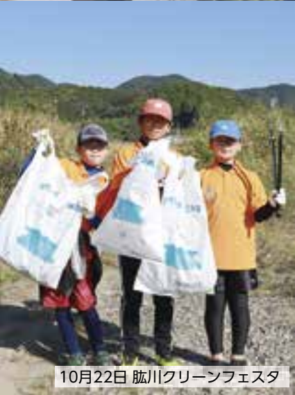
10月22日 肱川クリーンフェスタ