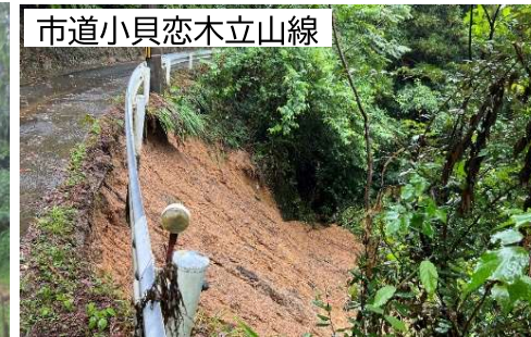
市道小貝恋木立山線