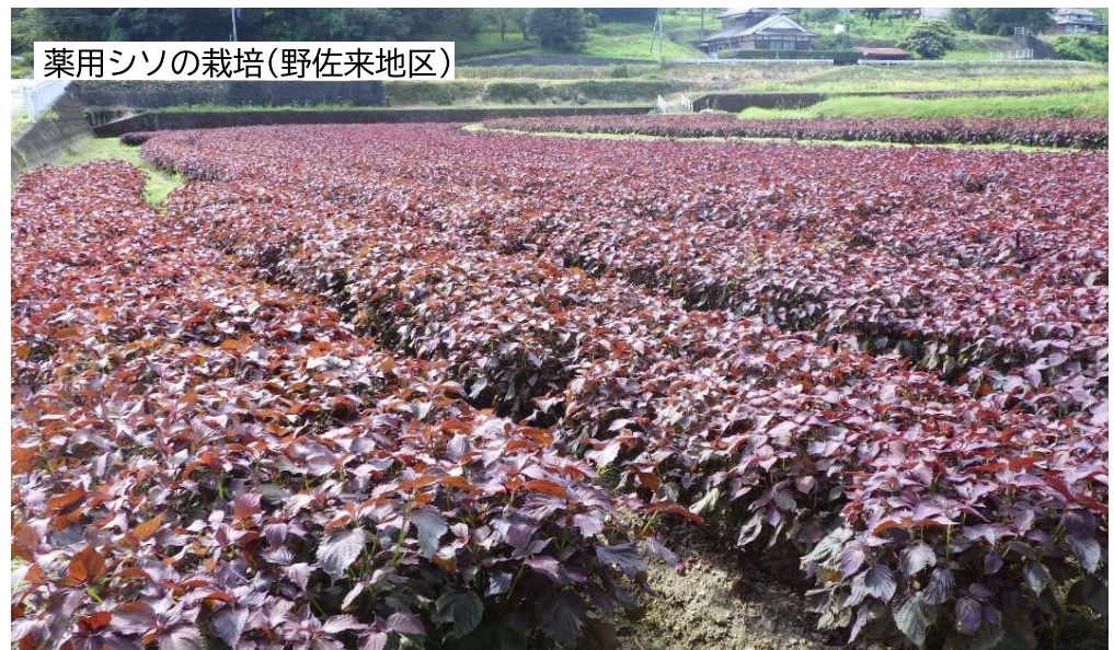
薬用シソの栽培(野佐来地区)