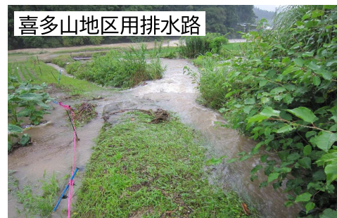
喜多山地区用排水路