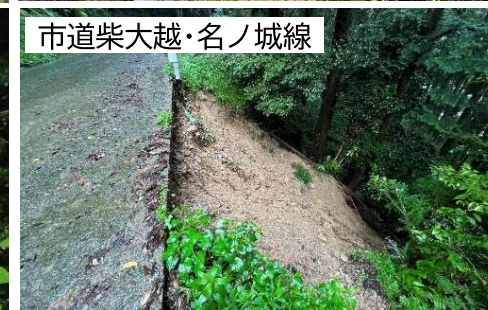
市道柴大越・名ノ城線