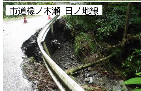
市道椽ノ木瀬 日ノ地線