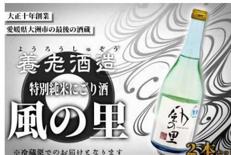
養老酒造の 『特別純米にごり酒』 寄附金額11,000円