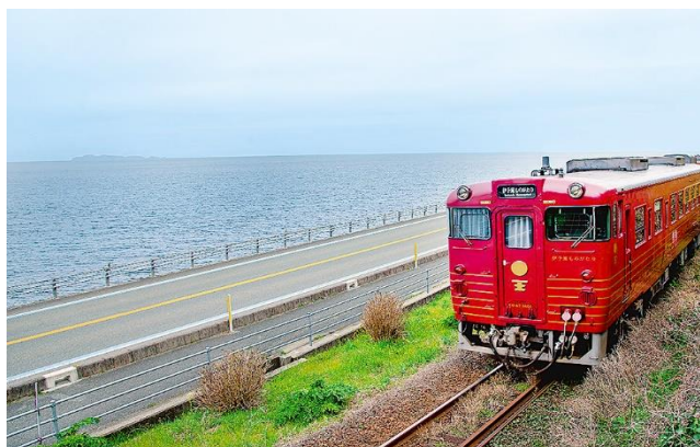
松山～大洲・八幡浜間を走る人気の観光列車 「伊予灘ものがたり」の乗客に向け 大洲の観光をPRしました。