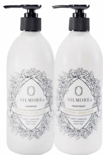
SILMORE (シルモア) ジャンプー395ml&トリートメント395gセット 寄附金額26,000円

養蚕業は大洲地方の古くからの 伝統産業のひとつで、 繭の生産量は現在愛媛県の約60%を占めています。