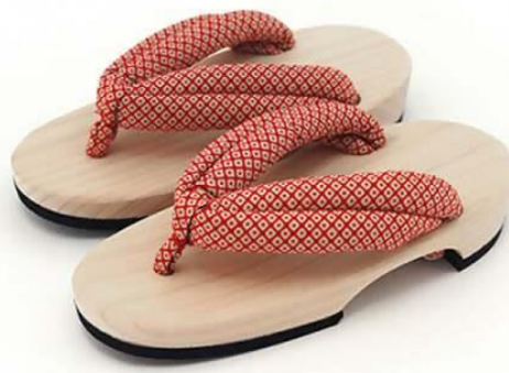
長木保育下駄ソフト(全5サイズ) 寄附金額10,000円

肱川の下流域である大洲市長浜町は かつて木材の一大集積地であり、 木履製造が盛んでした。