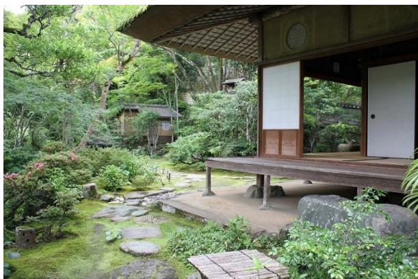
臥龍山荘の美しい庭園の維持管理のため 寄附を活用させていただきました。