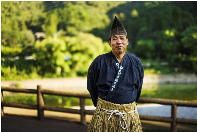
鵜飼文化を担う鵜飼の鵜匠