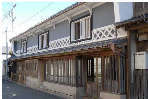
旧末永家住宅 旧末永家は大洲市長浜で海運業を営んだ資産家です。