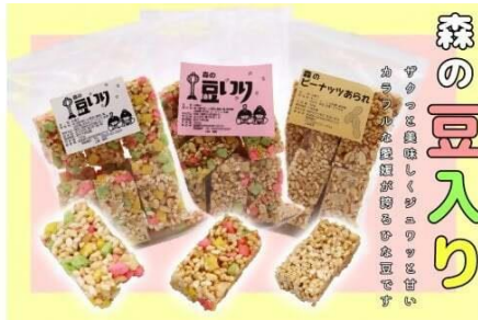
まめいりセット 寄附金額15,000円