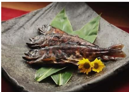
あまごの甘露煮 詰め合わせ 寄附金額17,000円