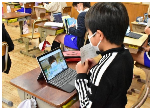
児童・生徒用タブレットのための費用にも活用させていただきました。