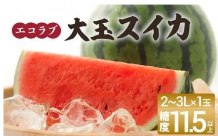
エコラブスイカ1玉(大玉) 寄附金額10,000円

ええモンセレクション 認定商品の「てんたかく」は 炊きあがりのツヤと甘味が特徴。