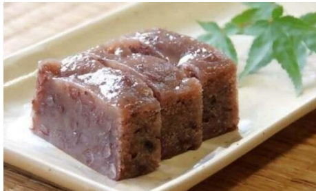
志ぐれ 3本入 (菓子処 氣晴) 寄附金額10,000円