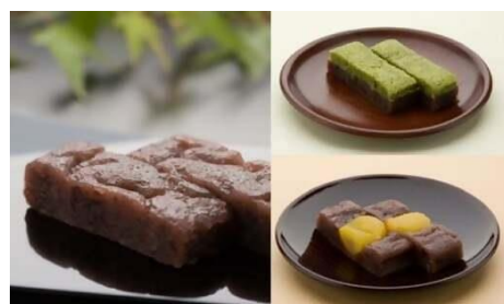
ひとくち生志ぐれ 3種16個入り (有)富永松栄堂) 寄附金額10,000円