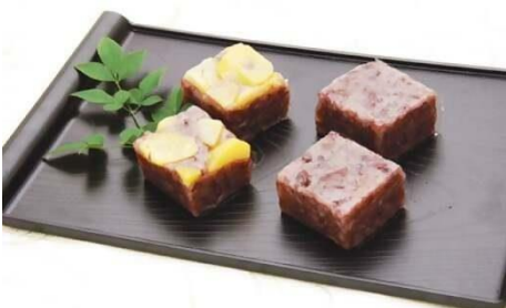
志ぐれ詰合せ (山栄堂) 寄附金額10,000円

小豆と餅粉や米粉を混ぜ合わせ、セイロで蒸しあげた和菓子で、大洲藩江戸屋敷の秘宝菓子として大洲に伝承したといわれています。モチモチとした食感が特徴です。 店舗によって食感・風味も様々！お気に入りの志ぐれをぜひ見つけてください。