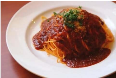
ビストロの 手作りミートソース 寄附金額10,000円