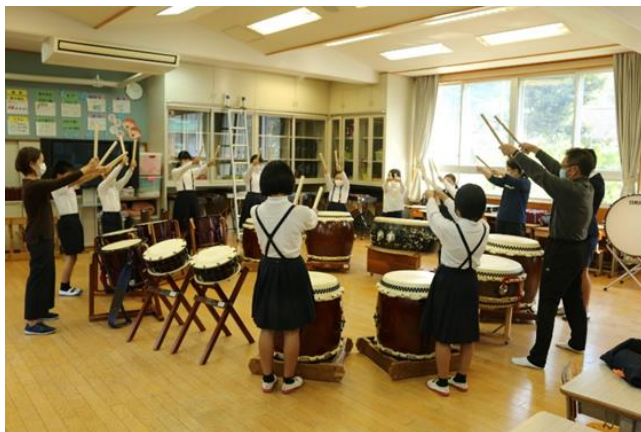
キッズ・和太鼓プログラムの様子