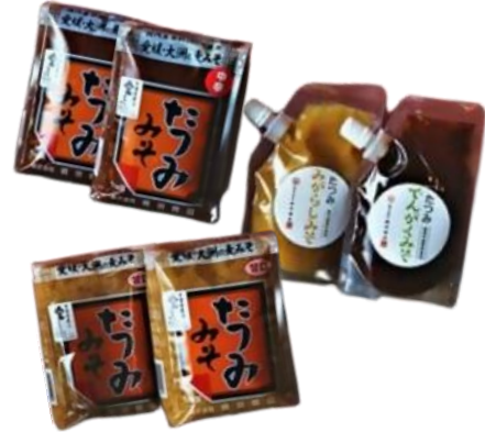
たつみ 麦みそセット 寄附金額10,000円