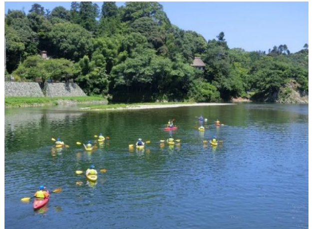
カヌー観光事業にも活用させていただきました。