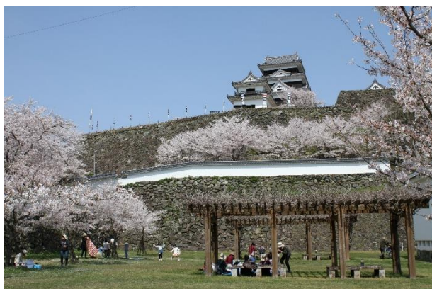
大洲城の麓にある「城山公園」は 市民や観光客の憩いの場となっています。