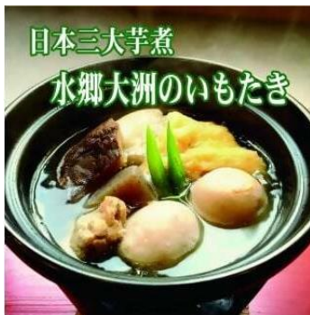
水郷大洲たる井の「元祖いもたき」 寄附金額12,000円