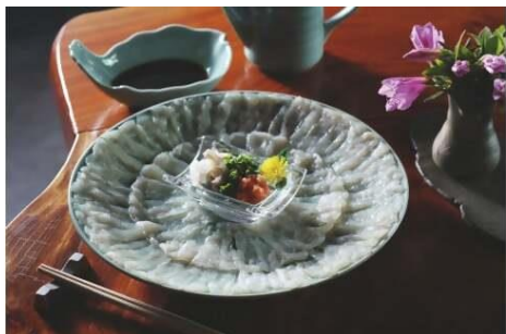
天然トラフグ うすづくりセット 寄附金額90,000円