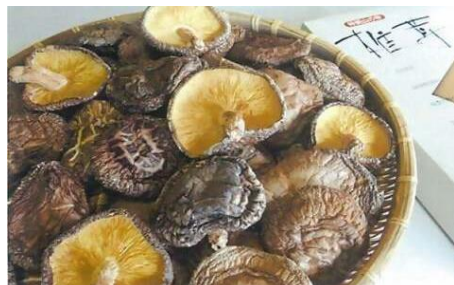
乾しいたけ(香信)100g 寄附金額10,000円