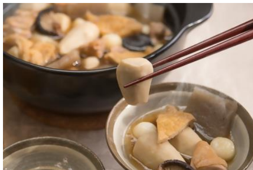
大洲のこだわりいもたきセット 寄附金額12,000円

日本三大芋煮の1つ 粘り気が強い大洲産の 里芋と鶏肉を中心に、 乾しいたけ、こんにゃく などを入れて煮込んだ 醤油ベースの少し甘 めの味。