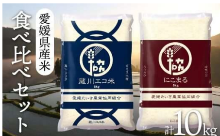
愛媛県産米「食べ比べセット」 (にこまる5kg、てんたかく5kg) 寄附金額13,000円

ええモンセレクション 認定商品の「てんたかく」は 炊きあがりのツヤと甘味が特徴。