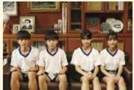
体験終了後、市長室で記念写真

7月第1週、大洲北中学校と肱東中学校から14人の生徒が大洲市役所で職場体験をしました。広報広聴係でも7日(金)に4人の生徒が、広報おおずや公式Instagramの取材などを体験しました。いもたき特集の取材にも同行してもらい、大洲のいもたきに携わる人の思いを聴くことで地元愛が深まったのではと期待しています。