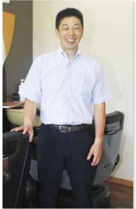
CUTSALON MAR (カットサロン マル)

いま、私の長男も理容の道に進んでいます。経験を積んでいつかは故郷の大洲に戻ってきてもらい、この店舗で私と妻、長男の3人がお互いの技術を磨き合い、お客さんの笑顔のために働くことができる日が来ればと考えながら、毎日ハサミを握っています。