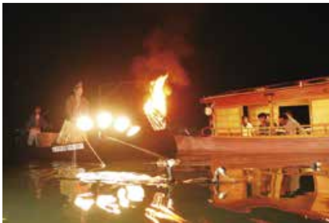
うかいの夜 (6月28日(水)撮影)