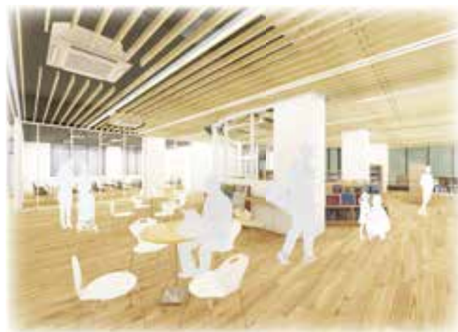
全体が見通せる1階オープンフロア（イメージ）

図書館肱川分館は引っ越し・開館準備のため、7月10日(月)から31日(月)まで臨時休館します