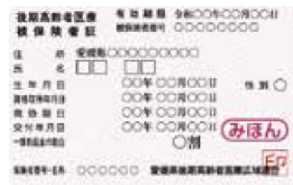
8月1日からの保険証

現在の保険証（オリーブ色）の有効期限は、7月31日(月)です。 8月1日(火)からは新しい保険証（薄桃色）に変わります。