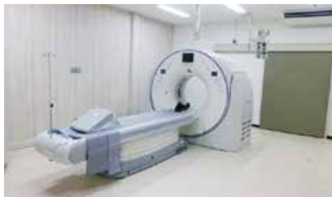
全身用X線CT診断装置