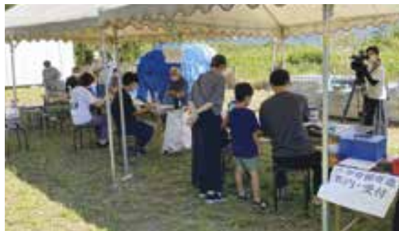
古学堂復活プロジェクト(令和4年度採択事業)