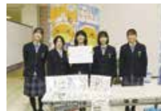
地域探求プログラム 全国大会出場 (長浜高等学校)