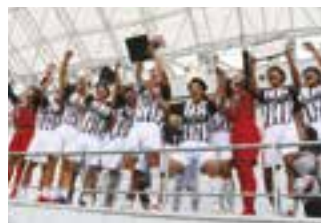
全国高等学校 サッカー選手権大会出場 (帝京第五高等学校サッカー部)