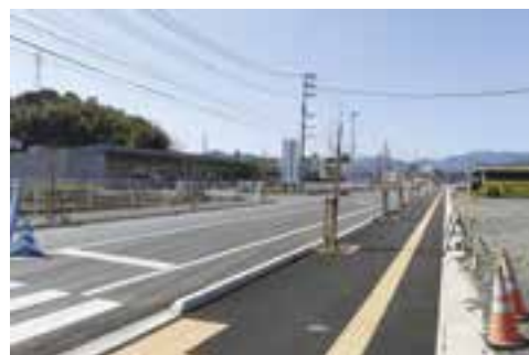
新設路線と新設バス停予定地(㈱よんやく前)