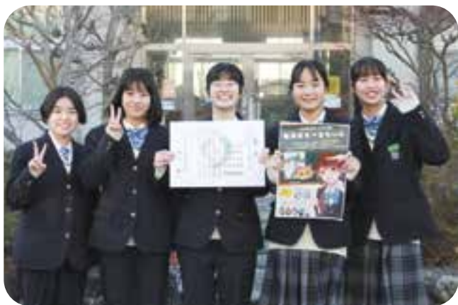
長浜高等学校 1年 (取材時)