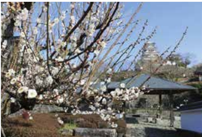
内堀菖蒲園の梅と大洲城（2月22日撮影）