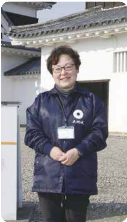
大洲城管理事務所