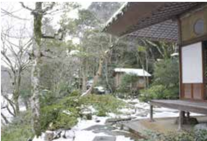
雪の臥龍山荘 (12月23日(金)撮影)