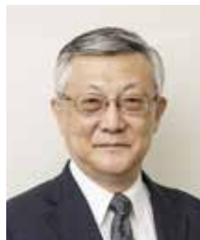
埼玉医科大学 客員教授