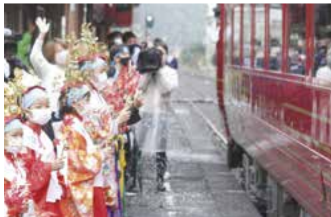
写真：伊予灘ものがたりを見送る稚児たち

11月23日(水)、白滝地区の伝統行事である「るり姫まつり」が開催されました。祭りには地元の小学生たちに加えボランティアとして高校生が参加し、きらびやかな衣装を身にまとった稚児たちは、まずJR伊予白滝駅で観光列車「伊予灘ものがたり」をお出迎え。西龍寺で法要を行った後、白滝公園内のるり姫親子観音像まで歩き、担いで登った花神輿 みこし を雌滝の滝つぼに投げ込みました。また、公園入り口では地元有志による出店が開かれ、祭りを盛り上げました。