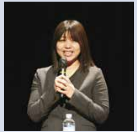
NIPPONIA HOTEL 大洲 城下町 副支配人

この町で過ごしてきた時間はまだ2年と短い、昔から住んでいると日常の中ではなかなか気づかない大洲の良さを「よそ者」の私が伝えていくという思いでこれからも地域のみなさんと手を取り合いながら働いていきたい。