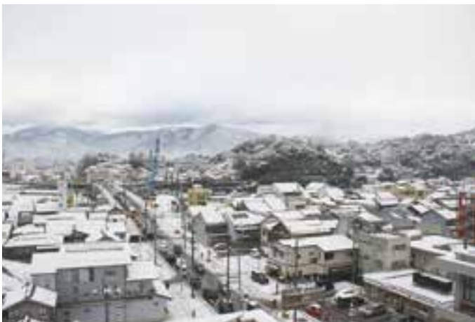
市役所屋上からみた肱川橋と雪景色 (12月19日撮影)