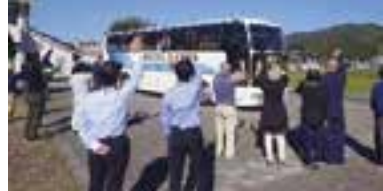
宝仙学園（大川地区宿泊班）のみなさん

わずか二日間の交流でしたが、どの班もまるで親と子、孫のように笑顔があふれます。離村式では涙を流し別れを惜しむ生徒もいて、それを優しく見つめる受け入れ家族の姿やバス出発後もお互いが見えなくなるまで手を振り続ける光景が印象的でした。