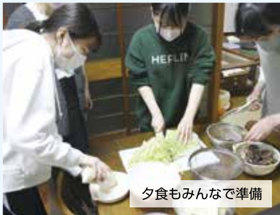
夕食もみんな準備