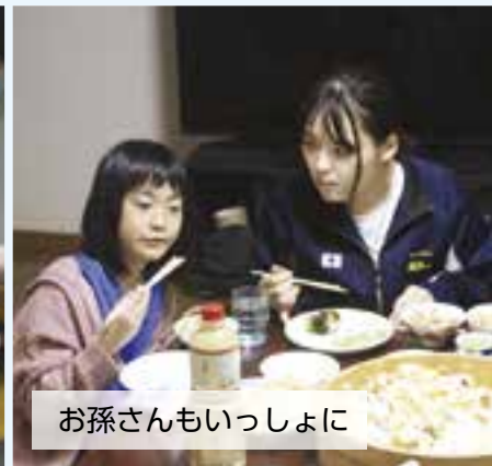
お孫さんもいっしょに