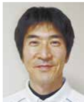
四国学院大学 社会学部教授 健康運動指導士会 香川県支部長