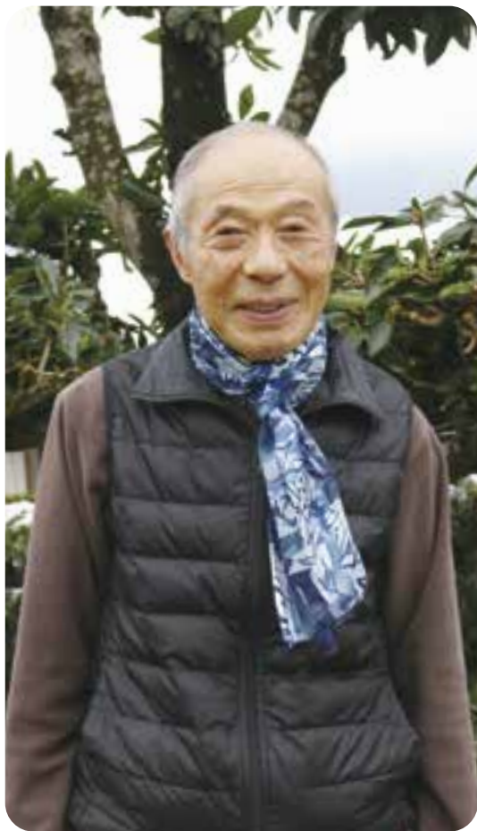
大洲アーティストグループ エンゼル