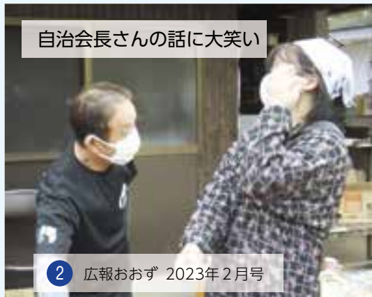
自治会長さんの話に大笑い