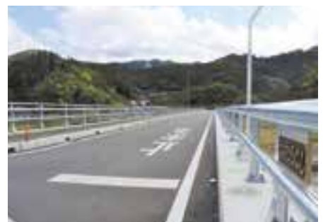
令和4年6月に完成した大成橋