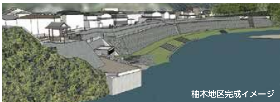
柚木地区完成イメージ