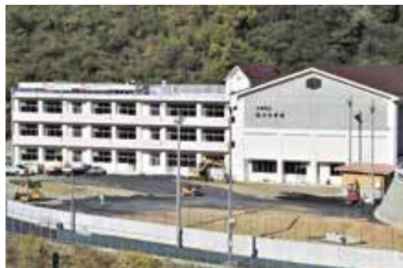
完成間近になった肱川中学校の校舎と体育館 (令和4年11月12日現在)