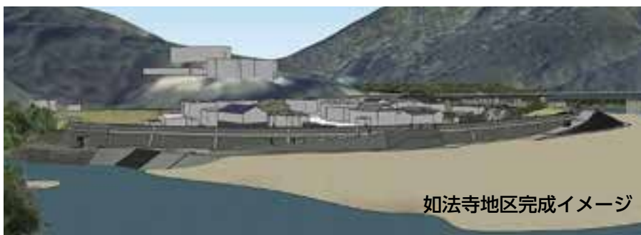
如法寺地区完成イメージ