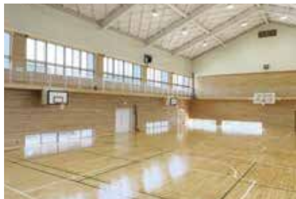
令和4年8月に完成した平小学校屋内運動場