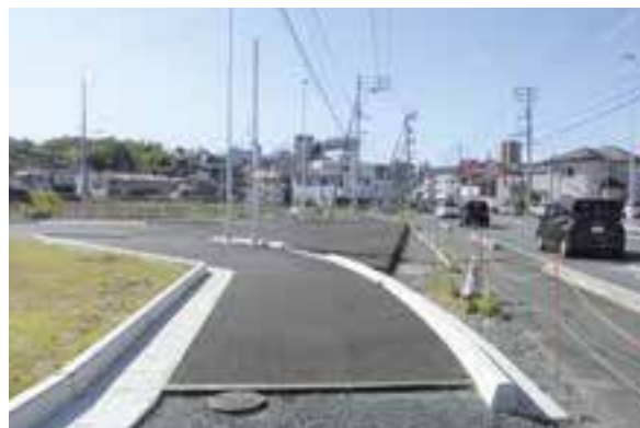
整備が進む街路事業（若宮東大洲線・大洲徳森線） (令和4年10月24日現在)