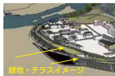
緑地・テラスイメージ