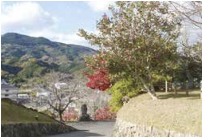
大洲城周辺に咲く寒椿（12月2日(金)撮影）