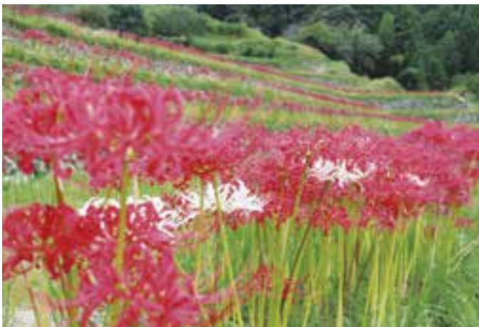
稲積地区に咲くヒガンバナ（9月29日(木)撮影）