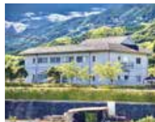
肱南浄化センター