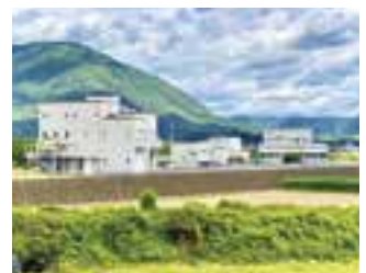
肱北浄化センター