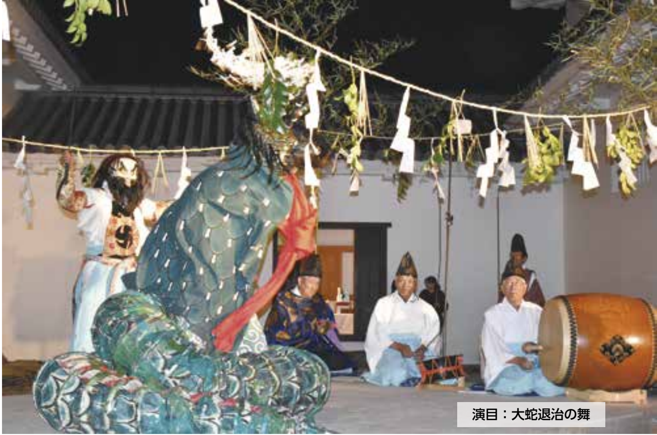
演目：大蛇退治の舞