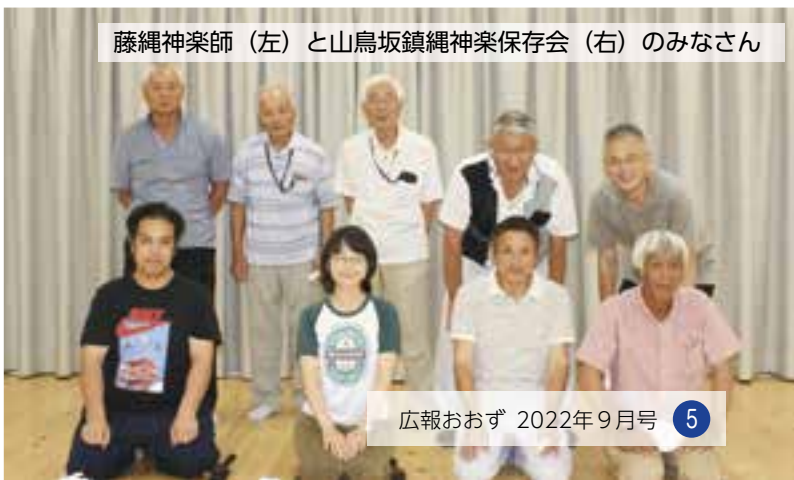
藤縄神楽師（左）と山鳥坂鎮縄神楽保存会（右）のみなさん