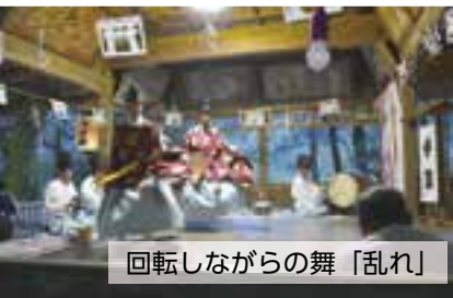
回転しながらの舞「乱れ」