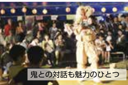
鬼との対話も魅力のひとつ