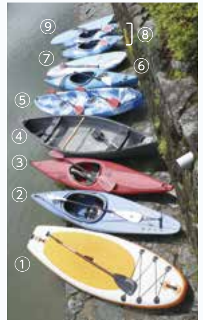
大洲カヌー同好会などが所有するカヌー、SUPの一部