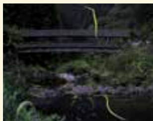
6月9日(木) 20:30頃 龍王橋(河辺地区)付近を飛び交うホテルもホテルを見つけたいと思います。

平野地区、柳沢地区、河辺地区などさまざまな場所でホテルが飛び交う姿を撮影しました。