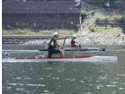
カナディアン（おしどり湖カヌー大会）