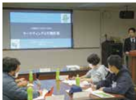
令和2年度の 開催状況