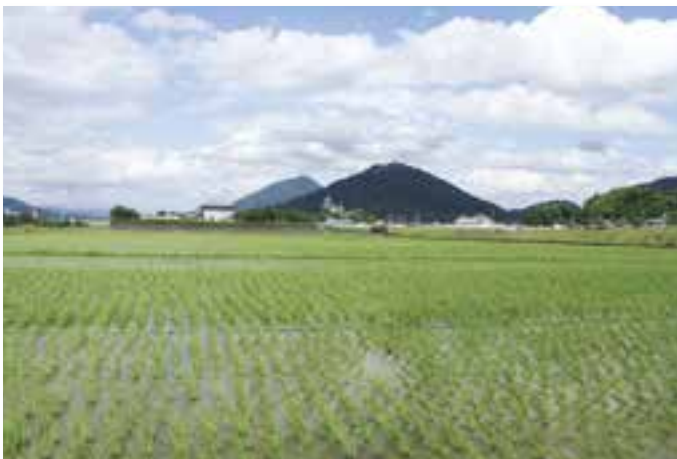
西大洲の田園風景 (6月24日(金)撮影)