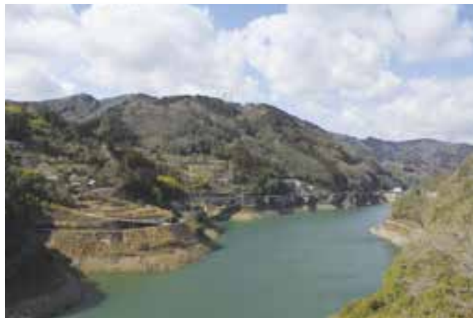
おしどり湖 (鹿野川湖) (2月20日(日)撮影)