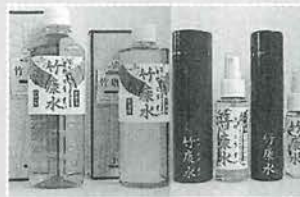
たけこうすい 「竹康水」 《スプレー・ボトルタイプ》

日本中でここだけの“珍商品” 満月の夜に焼く“月の神秘が宿る塩” 含有ミネラルが高級塩の約5倍 焼肉・焼鳥・焼魚・各種お料理に最適 豊かな旨みと食感