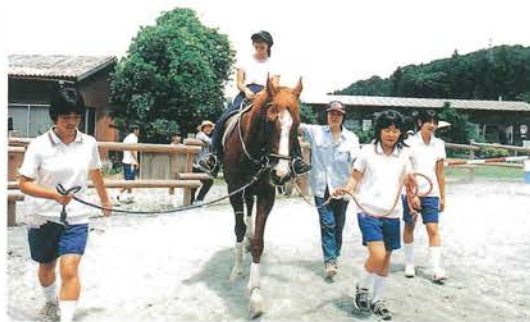
乗馬クラブで乗馬体験

乗馬ではみんなとても楽しそうに過ごして、肱川での楽しい思い出ができたので本当によかったです。川で遊んだときは、みんなはしゃいで、その頃にはもうすっかり友達になっていました。肱川中から贈ったカプトムシ、大切に育ててほしいです。そして、成長した姿を見せてほしい。盲学校からのプレゼントの植物も大切に育てています。今度、こういう学習があつて、また会えるなら、松山へ行つて、その時は、盲学校の人を書いてくれた地図を一緒に見ながら歩きたいと思つています。