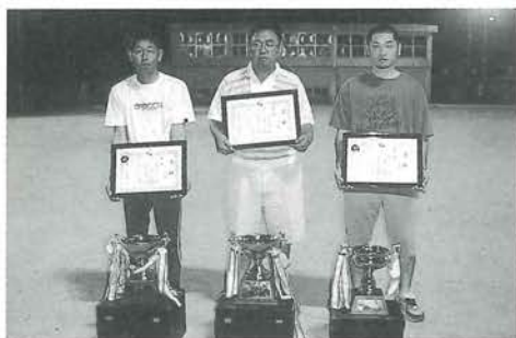
ソフトボールリーグ戦 閉幕式

5月6日に開幕した「第32回ソフトボールリーグ戦」が7月13日に終了し、閉幕式を町民運動場で行いました。