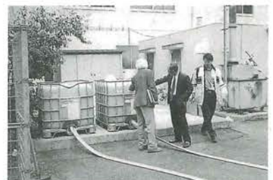
役場裏でEMの二次培養をしている