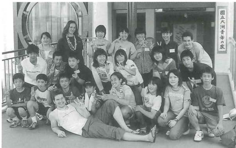
キャンプに参加した肱川中学校の生徒たち

7月3日・4日の土日を利用して、「国際交流サマーキャンプ」が国立大洲青年の家で開催されました。参加した中学生たちは、在日外国人との交流を通して、異文化の体験と国際理解を深めることができました。また、ゲームや英語版ウォークラリー等を体験し、英語学習への興味や関心をより一層高めることができました。