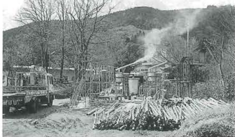
材料の孟宗竹と炭窯

私は、昭和26年2月15日生まれの53歳です。福岡県柳川市で生まれ育ち、今年、縁あって肱川町にきました。妻と次男、三男の家族4人で竹炭を焼いています。