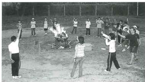
ゲームやダンスで盛り上がったキャンプファイヤー

したことです。あのダンスはちょっとハードでした。カヌーでは、雨が降らずにできたのがとってもうれしかったです。上手にはできなかったけれど久しぶりに川で遊んだので、気持ちよかったです。サマーキャンプでは、外国のことなどいろいろなことを学べてとっても楽しかったです。私は3年だからもう行かないけれど、もし来年またあったら後輩たちにぜひ行ってもらいたいです。