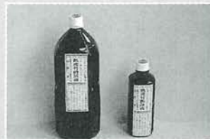
じゅくせいたけすげんえき 「熟成竹酢原液」 《お風呂用》

殺菌・抗菌・消臭・消炎作用 トイレ・生ゴミ・ペットなどの消臭に 足元やお口の消臭・エチケットに 水虫・虫さされ・日焼け・アトピーに 毎日のスキンケア・ヘアケアに