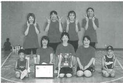
優勝「予子林アカレンジャー」

各ブロックの1位のチームが決勝トーナメントに進み、決勝戦では、「予子林アカレンジャー」が前年優勝した「スマイル」に勝ち、初優勝しました。準優勝は「スマイル」、3位は「雷神正山」でした。選手、役員の皆さん大変お疲れ様でした。