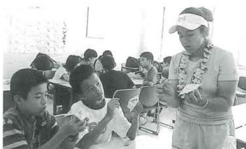
グループ活動で外国の文化に触れる