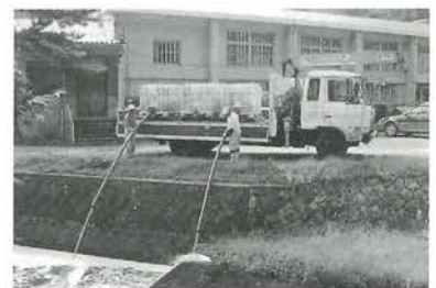
神竜湖へのEM活性液投入の様子

1回1,000ℓ、町役場裏の川から週1回2,000ℓ、町役場と神竜湖の中間点から週1回2,000ℓ、毎週ボランティアによって他の6ヶ所からそれぞれ1,000ℓ、