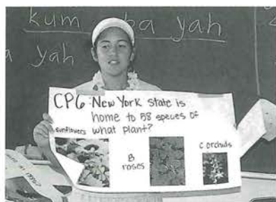
クイズの答え合わせ

自己紹介が終わると、マカレナというダンスをしました。はずかしかったけど、リズムのよいダンスにノリノリでした。その後、昼食を食べに行きました。