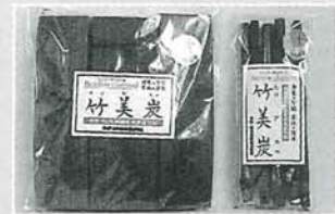
たけびたん 「竹美炭」 《板炭・マドラー》

殺菌・抗菌・消臭・消炎作用 毎日のお風呂で手軽にスキンケア アトピーや水虫などにも効果的 お風呂にキャップ3杯(約20cc) 残り湯洗濯で除菌・ゴワつき防止に