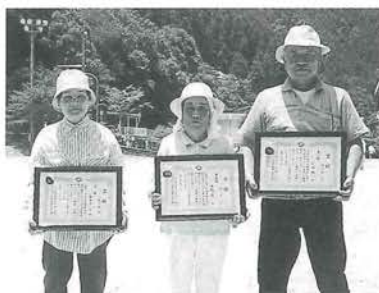
個人 左1位 中2位 右3位