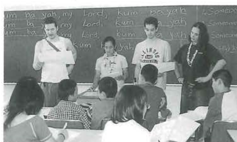
ウォークラリーについて念入りに打合せ