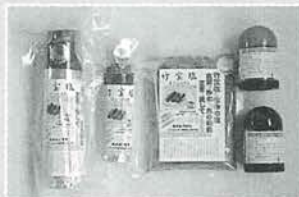
たけほうぜん 「竹宝塩」 《竹炭炭焼・食卓用・詰替用》

(お風呂に熟成竹酢原液が、歯ミガキ、女性のスキンケアに竹康水が好評です。) 製品は、森林組合で展示販売しています。