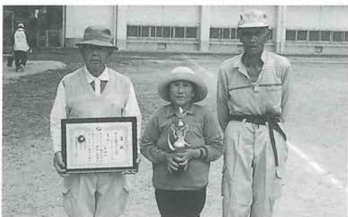
グランドシニアの部優勝 大谷Aチーム