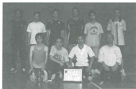
男子バレー優勝 上鹿野川Bチーム