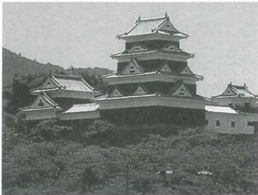
大洲のシンボル、大洲城が木造で復元されました。