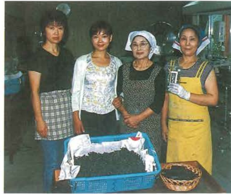
生活研究会「さくらんぼ」のみなさん