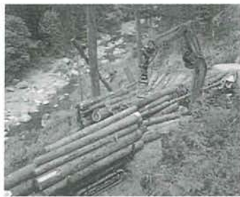
若者達が頑張って、 山から木を出しています。