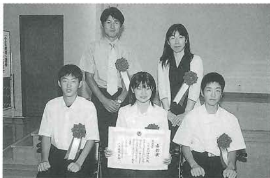
尾山賞を受賞した 肱川中学校のみなさん

「小さな親切」運動愛媛県本部の総会において、身近な親切やボランティア活動に取り組んだ肱川中学校など県内の6個人・団体に尾山賞が贈られました。