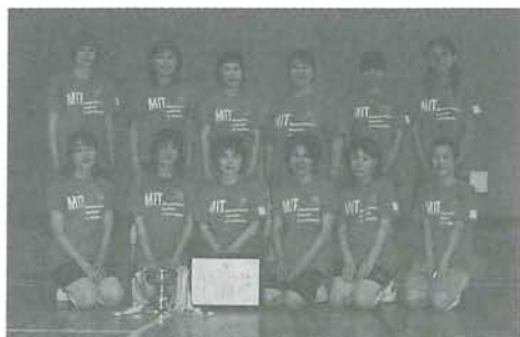
女子バレー優勝 上鹿野川チーム