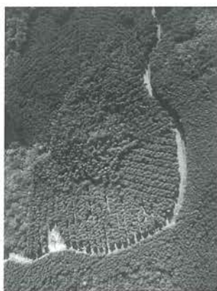
列状間伐で施業された森林

木材価格が低迷している今、尚一層の経費低減に取り組み、山を守っていききたいと話しておられました。