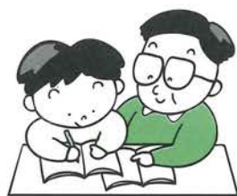
子どもをほんとうに思いやる

子どもの存在に感謝し、尊敬を払い、愛情を深めていくことによって、親子の関係は進歩していきます。思いやりの心をもって接すれば、話をするのが安心して楽しくなり、いじめなどの悩みも自然に親に打ち明けられるようになるはずです。