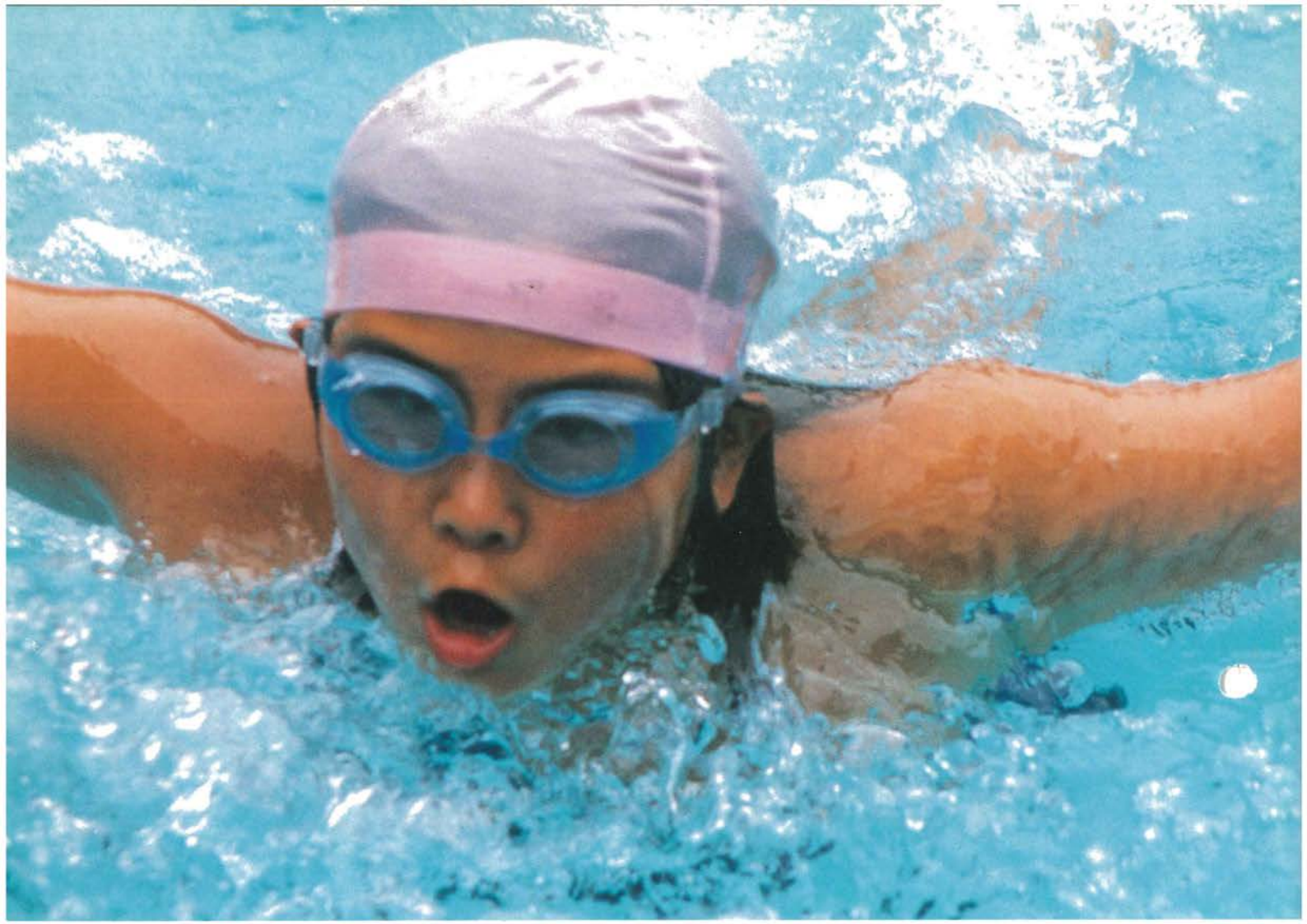
バタフライの迫真の泳ぎ