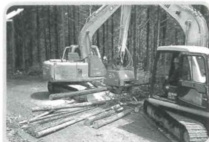
プロセッサーによる造材