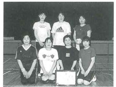
準優勝の中野チーム

町内レクリエーションバレーボール大会を7月13日、脇川中学校、中野小学校、大谷小学校の各体育館で行いました。参加したのは、14チーム、110人。各会場とも実力伯仲で白熱した試合となり、お互いに親睦と交流を深めました。各ブロックの予選1位が決勝リーグに進み、去年に続いて「スマイル (大谷)」チームが優勝しました。 準優勝は「中野」チーム、3位は「予子林 A」チームでした。選手、役員の皆さん、お疲れさまでした。