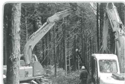
スウィングヤーダーによる集材