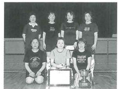
2連覇達成 スマイルチーム