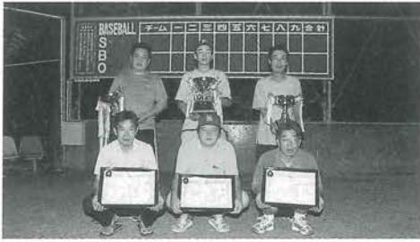
各部の優勝チーム 左から 上鹿野川、予子林イチウリーズ、大谷

優勝は 上鹿野川 B (Ⅰ部) 予子林イチウリーズ (Ⅱ部) グレードアップ大谷 (Ⅲ部)