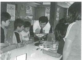
こんなこともできるんだよ