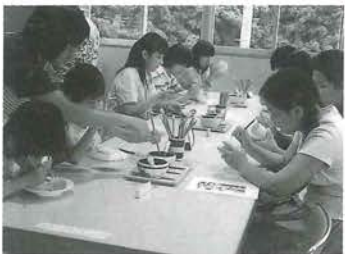
とべ焼絵付け体験