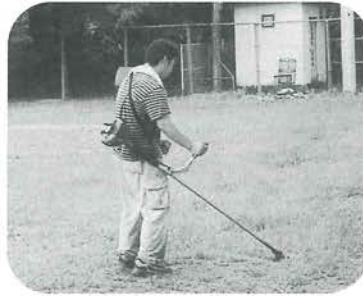
まじめに草刈り中

今年も、毎年恒例の高砂グラウンド周辺の掃除を行いました。雨のなかでの掃除でしたが、みんな一生懸命に頑張ったので、大変きれいになったのではないかと思います。皆さん、大変お疲れ様でした。