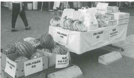
こんなにたくさんの景品の提供がありました。