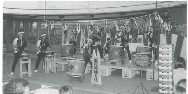
風陣太鼓で夜市が開幕