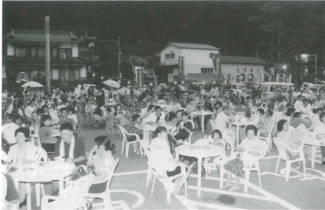
駐車場がビアガーデンに