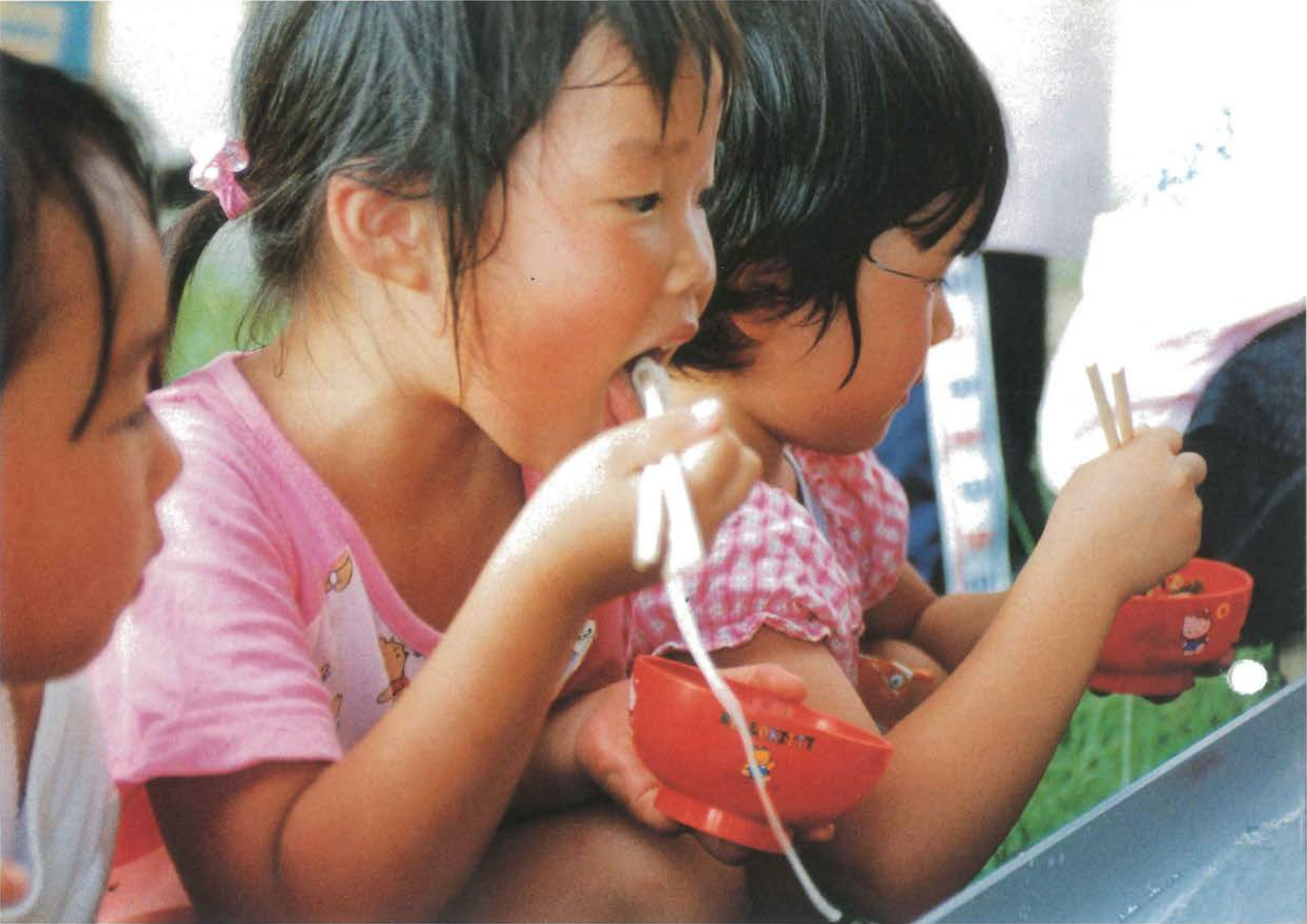
そうめん流しを楽しむ園児たち