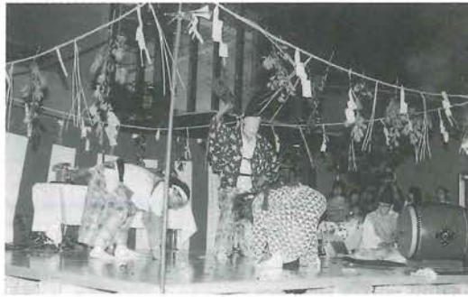
山鳥坂鎮縄神楽の熱演

道の駅清流の里ひじかわで7月20日、夜神楽・夜市が開催されました。約1000人が詰めかけた道の駅の駐車場ではビアガーデンがオープンし、景気の良い風陣太鼓の音とともに夜市が開幕。かがり火のともる舞台では山鳥坂鎮縄神楽の熱演があり、観客を沸かせました。最後に、スイカやバナナ、ぶどうなどが当たるお楽しみ抽選会では当選した人の歓声があちこちで聞かれました。この日の夜市を契機に道の駅清流の里ひじかわの利用者がさらに増えてほしいものです。