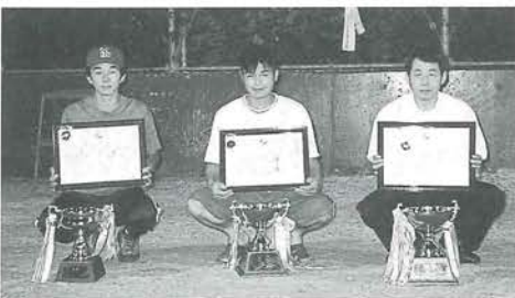
予子林イチウリーズ、道野尾・山楯、大谷ファイヤーストーンズ

4月25日に開幕した「第30回ソフトボールリーグ戦」が7月4日に終了し、閉会式が高砂グランドで行われました。今年度は20チームの参加がありました。試合は3部門に分かれプロック別リーグ戦とし、夜7時30分から1日2試合を計画的に実施してきました。大会運営には、各チームの責任者(監督)、主審、塁審の皆さんに役割分担をいた