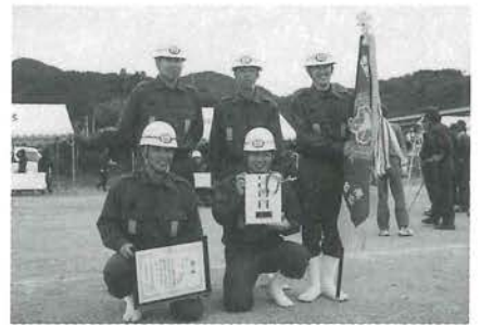
操法大会出場選手

肱川町消防団の優勝は、前回の第5分団に引き続き大会2連覇となり、第1分団としても前回に引き続き優勝という輝かし