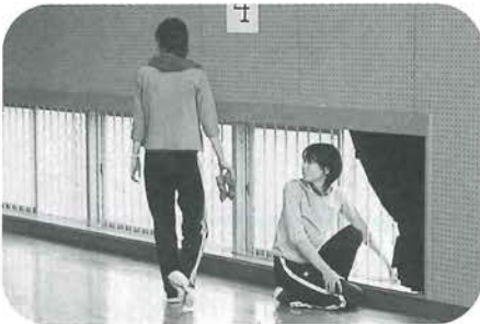
あっちはまだなのかなあ...

今年も、毎年恒例の高砂グラウンド周辺の掃除を行いました。雨のなかでの掃除でしたが、みんな一生懸命に頑張ったので、大変きれいになったのではないかと思います。皆さん、大変お疲れ様でした。