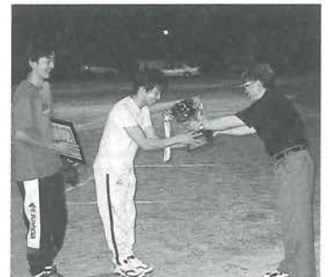
体育協会会長から優勝カップ授与

だきましたのでスムーズに運営することができました。また、ソフトボールの振興や参加チーム相互の親睦等当初のねらいを十分に達成することができました。閉会式では、肱川町体育協会会長から健闘したそれぞれ上位3チームに賞状が授与されました。結果は標記のとおり。