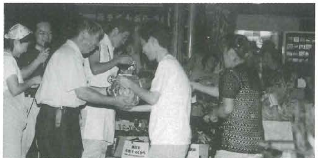
スイカが大当たり！