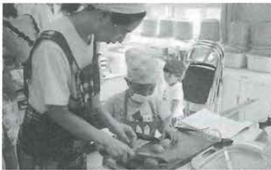
お母さんに教わりながら キウイフルーツを切りました。

7月25日、中野小学校で午前9時から、親子生活習慣病予防教室を行いました。 この事業は、子供のころから多くなっている、高血圧・動脈硬化