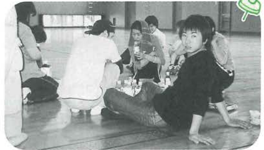
楽しみのお昼ごはん

今年もトレセン掃除の季節がやってきました。1年間の汚れはすごいものでしたが、きれいになると爽やかな気持ちになりました！ でもやっぱり暑い1日でした。皆さんおつかれさまでした。 谷田