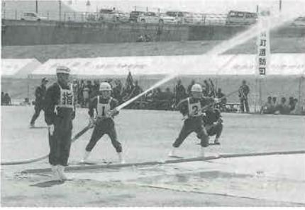
放水のようす。タイムも上々。

この大会は、消防団員の志気の向上と消防精神の高揚を図ることを目的に隔年で行われており、