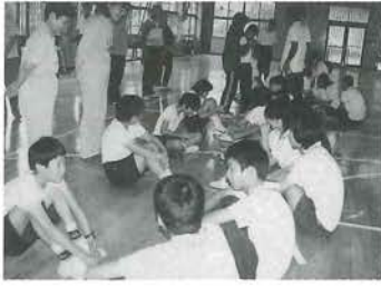
積極的に話しかけようとする 肱川中学生たち

当日は、午前中に風の博物館の風洞実験機を使って風速15メートルの風を体験しました。また、乗馬の体験をしたり、給食の後、役場裏の河原で