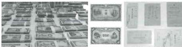
(紙幣) (旧日本銀行券) (通帳・小切手)

松山税関支署管理課 〒791-8058 松山市海岸通2426-5 ☎ 089-951-0301