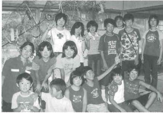
「子ども会はたのしいな」 広常子ども会のみんなはとってもなかよし

広常子ども会の学習会が7月25日、広常集会所で午後1時から開催されました。夏休みが始まって一週間あまり。子どもたちは、久しぶりに一緒に勉強するとあって、集会所に集まるとすぐに「夏休みの宿題」に取りかかっていました。むずかしい宿題は、中学生のお姉さんにたずねたり、中学校の先生や係のお母さんたちに手伝ってもらったりして勉強をすめました。また、「七夕飾りの製作」では、画用紙や折り紙で思い思いのものを作ったり、短冊に願いを書いたりして共に作る喜びを味わいました。