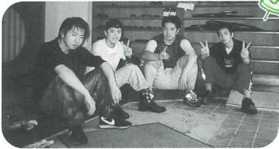
草刈り部隊の皆さん