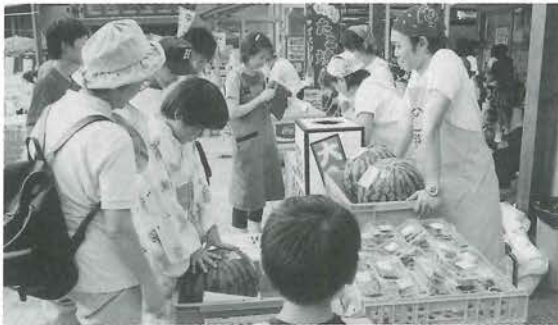
スイカの重量当てクイズ。何キロぐらいかな？

道の駅清流の里ひじかわで7月20日、夜神楽・夜市が開催されました。約1000人が詰めかけた道の駅の駐車場ではビアガーデンがオープンし、景気の良い風陣太鼓の音とともに夜市が開幕。かがり火のともる舞台では山鳥坂鎮縄神楽の熱演があり、観客を沸かせました。最後に、スイカやバナナ、ぶどうなどが当たるお楽しみ抽選会では当選した人の歓声があちこちで聞かれました。この日の夜市を契機に道の駅清流の里ひじかわの利用者がさらに増えてほしいものです。