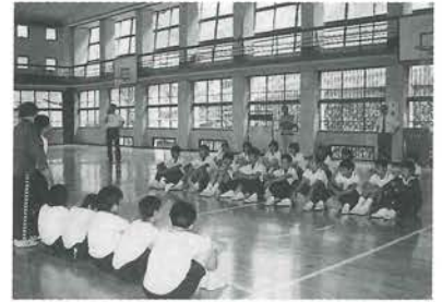
すこし緊張した自己紹介

水遊びをしたりして交流を深めました。初めはとまどいを見せていた両校の生徒たちも徐々にうちとけて会話がはずむようになり、乗馬体験の場面ではお互いに馬に乗ったり、たづなを引いたりしながらなかなか雰囲気をつくることができました。この交流を通して、生徒たち一人ひとりが目の不自由な人と関わることの大切さ、そして、頼りにされたり、感謝されることの喜びを感じることができました。「また来年も会おうね。」と言ってみんな笑顔でお別れをした場面に感激しました。20年近く続いている盲学校との交流は、学ぶことの多い体験活動となりました。