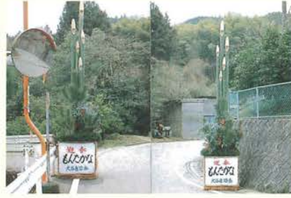
歓迎の門松(大屋敷入口)