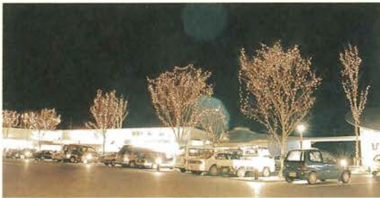
道の駅 清流の里ひじかわ