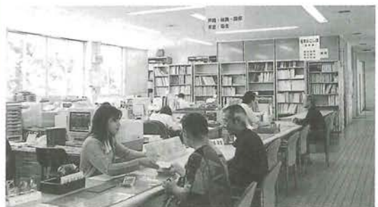
座って応待できるローカウンター

役場の機構改革が行われ、6月1日から各課の名称が親しみやすく、やさしい語感のする名称に変更になりました。併せて、高齢者等に配慮して、座ったままで応接ができるようローウンターを設置しました。職員の名札も一目で読めるよう大きなものに取替えました。