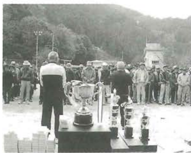
お互いの交流と親睦を...

12月5日、第1回肱川町長杯グラウンドゴルフ大会が肱川町民グラウンドで開催されました。この大会は、お互いの交流と親睦、健康づくり、軽スポーツの普及を図る目的で、肱川町老人クラブ連合会の協力を得て肱川町が主催したものです。当日は、町内各地区の老人クラブをはじめ、議会、郵便局、山鳥坂ダム工事事務所、役場理事者など22チーム約150人が集まりました。参加者の中には、グラウンドゴルフ