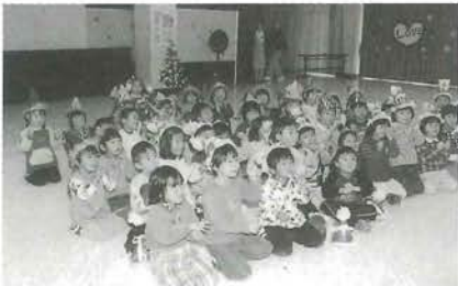
紙芝居に見入る園児

12月12日、町内4つの幼稚園が公民館に集まり、お楽しみ会が行われました。まず始めに先生方がリングベルで「きよしこの夜」を生演奏した後、それぞれの幼稚園が順番に歌や踊りを披露し、一人ずつ自己紹介しました。 続いて、キャンドルサービスやジャンケンによる勝ち抜きゲーム、ダンスを楽しみ、先生方による紙芝居や影絵に感動したり驚いたりしていました。 最後に先生2人が扮装したパンダとオカミからプレゼントをもらった後、中野幼稚園のお母さん方手作りのカレーライスをみんなで食べてお楽しみ会を終りました。 普段、顔を合わせたことのない町内の幼稚園児がこのような行事を通して顔と名前を覚え友達が増えれば、幼稚園での生活もさらに楽しく充実したものとすることでしょう。