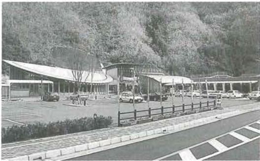
道の駅の農産物直売所と物産館周辺

農産物直売所では、地域の新鮮な野菜などの販売を行い、商業集積施設には町内の5店舗が出店しており、肱川町の地域活性化の経済拠点施設として期待されています。