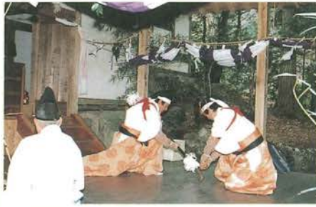
山鳥坂鎮繩神楽 (長刀の舞)

12月14日(旧暦10月最後の亥の日)に松島神社(菟野尾)で山鳥坂恵美須乙亥まつりが行われました。時折小雪の舞う寒い1日でしたが、6斗のもちが3回に分けてまかれ、鎮繩神楽も奉納されました。大判焼きや金物屋の出店も並び、参道を上ってくる参拝者が1日中絶えることがない乙亥でした。