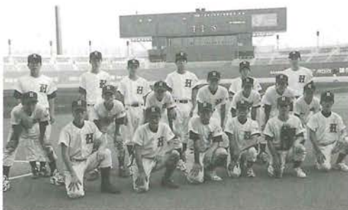
四国大会に出場した肱川中学校野球部