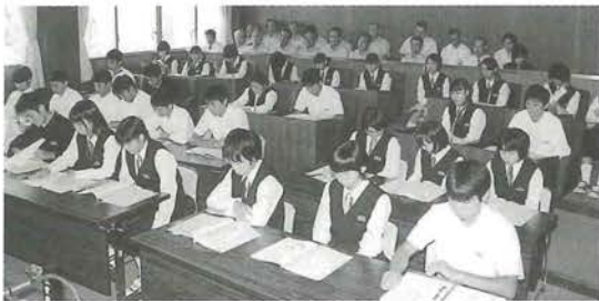
中学生による初めてのこども議会

一般質問では、7人のこども議員が観光、校舎の修理、ダム問題、市町村合併、高砂グラウンド、商業活性化、教育問題について質問し、肱川町の発展や将来像に対するそれぞれの真剣な思いを述べました。