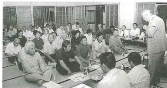
基本計画の見直し案説明会（岩谷地区）

11月16日に開かれた国交省四国地方整備局の事業評価監視委員会で審議の結果、中予分水を中止し、肱川の治水、河川環境整備、水利用を目的にダム建設事業は継続となりました。ただし、来年8月までに再見直し計画の提示と流域の合意形成を得た上で再審議されることとなりました。