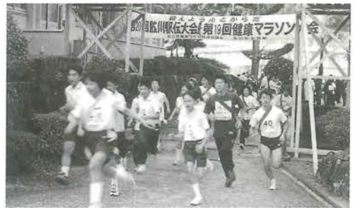
駅伝参加23チーム一斉にスタート