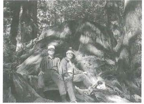
ウイルソン株 推定樹齢3000年 胸高 囲13・8m 1586年に伐採されたと言われる