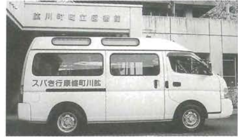
高齢者のための無料の健康行きバス

た。このバスは予約制で、週1回ずつ5地区を巡回し、自宅近くまで送迎します。また、高齢者が保養センターと鹿野川荘で入浴する場合には半額、または無料で利用できるサービスも行っています。