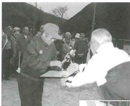
「優勝おめでとう ございます」