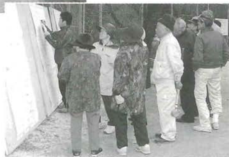
採点表も気にかかる