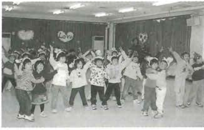
ラブラブじゃんけんのポーズ