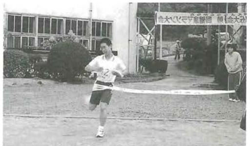
男子の部優勝 肱中野球A