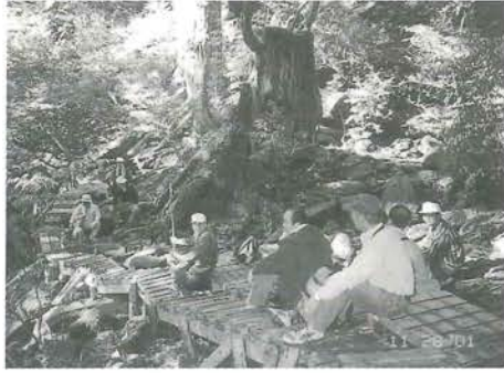
わずかな休憩タイム 此処から後1時間