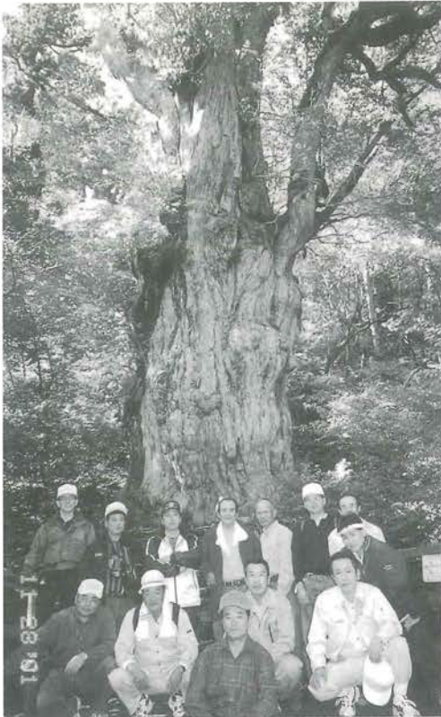
これが縄文杉7200年の迫力 胸高囲16.4m 標高1,300m そして満足 そうな会員たち

昨年11月27日から29日の3日間、肱川林研グループ にとって6年ぶりとなる県外視察研修を実施し、会員 12名で屋久島へ行ってきたので報告致します。私はN HKのプロジェクトX、そして肱中の少年式での映画 鑑賞(学校Ⅳ)の中で、屋久杉・縄文杉を見てぜひと も屋久島へ行きたいと願っていたところ、林研の事務 局を命ぜられ、これはチャンスとばかりに密かに計画 をたて会員に諮ったところ賛同を得ることができまし た。しかし、縄文杉を見るには屋久島で2泊しなければ ならないので、費用を抑えるため、大変ハードな行 程となり、自家用車・フェリー・貸切バス・飛行機・ レンタカーと乗り継ぎ、事務局・添乗員と初めての経 験で心配でしたが会員皆紳士ばかりで助かりました。