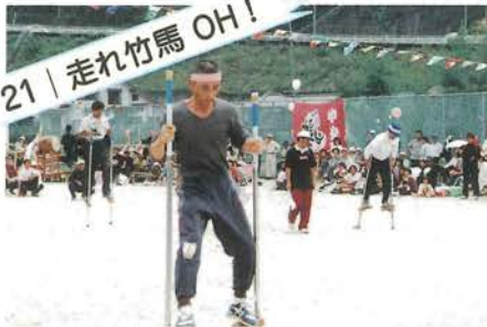
21 | 走れ竹馬 OH! 竹馬と悪戦苦闘 幼い頃の経験がものをいう