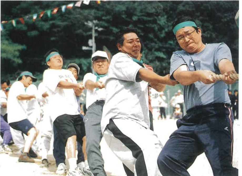
うーん。負けてなるものか!