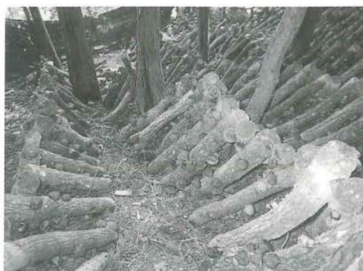
安全な肱川の原木椎茸

出荷されたスギ間伐材の平均単価が、材積1 m 当たり11,000円（これを整備基準単価とする。）を下回った場合に、整備基準単価との差額に対して材積1 m 当たり3,000円を限度として補助を行います。