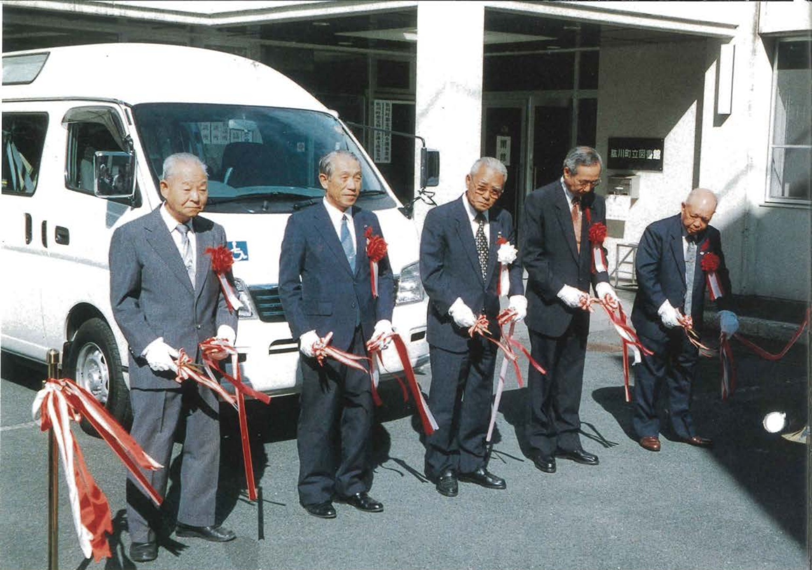
健康行きバスのテープカット