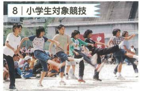
8 | 小学生対象競技