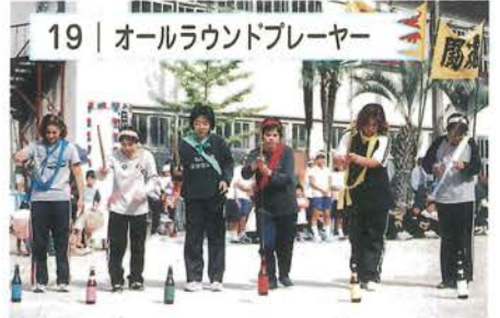
19 | オールラウンドプレーヤー