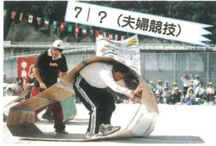
7 | ? (夫婦競技) 二人仲良くキャタピラーただひたすら前進するのみ