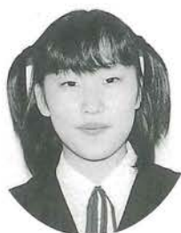
和氣 靖佳 議員

は議員さんとなって活躍していただく方が出たいと思っています。本日はあくまでも『こども議会』です。本議会にかけますと決めてしまうことができない部分がありますので、ご理解をいただきます。どうぞ今日一日が肱川町の将来にとって有意義なものでありますよう、私