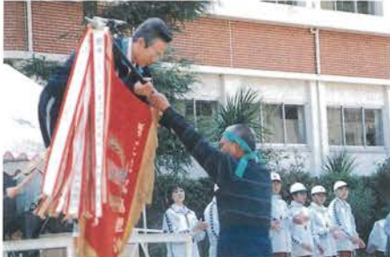
大谷分館が2年連続優勝