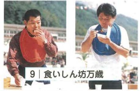
9 | 食いしん坊万歳