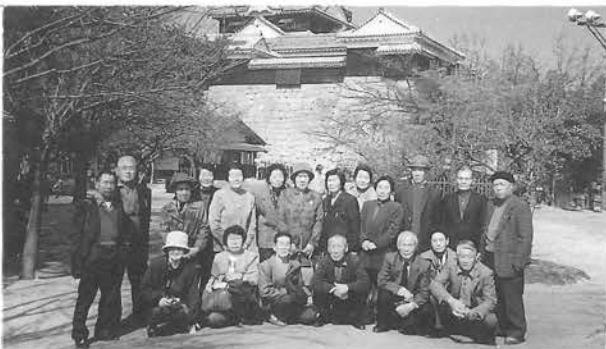
松山城での集合写真