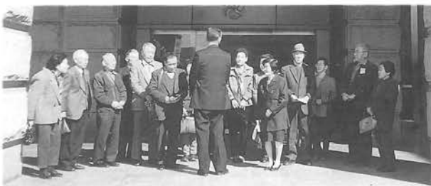
県庁前で説明を聴く学級生