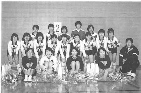
ダイキヒメッツと肱中女子バレー部

導がありました。普段気づかない練習方法や基礎練習など参加者も真剣に教わっていました。 最後に、中学生・女子バレー・男子愛好者とダイキヒメッツの四人にそれぞれ行い、有意義な体験が出来ました。