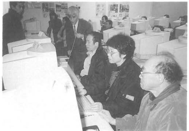
真剣に学習する参加者の皆さん

なお、4月以降も順次講習会が行われることになっておりますので、受講希望の方は、役場総務課までお申し込みください。