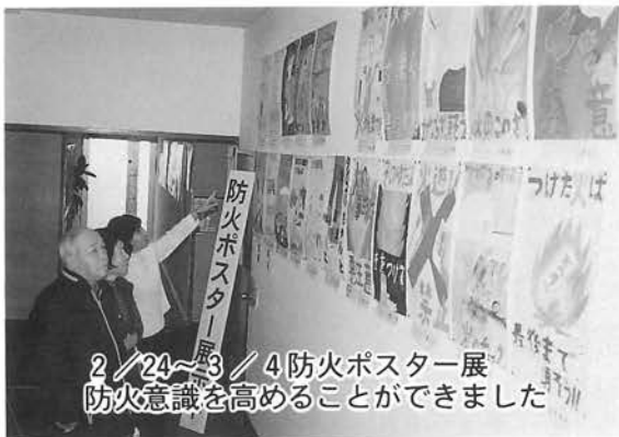
2/24~3/4 防火ポスター展 防火意識を高めることができました

○ 気象状況に注意し、風の強い日や空気が乾燥しているときは、集め焼きなどはやめましょう。