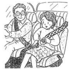
春の全国交通安全運動 (4月6日~15日)