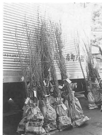
21世紀のスタートにちなんで 1戸1本植樹運動

「一戸一本植樹運動」がはじまり、桜、ハナミズキ、ケヤキの中から希望する苗木を各戸に一本ずつお届けしました。これは、自然共生型の地域づくりをめざして実施された植樹一万本計画のひとつであります。豊かな自然、美しい川を大切にしましょう。水を育む森林、をわたしたちの手で守り育てましょう。