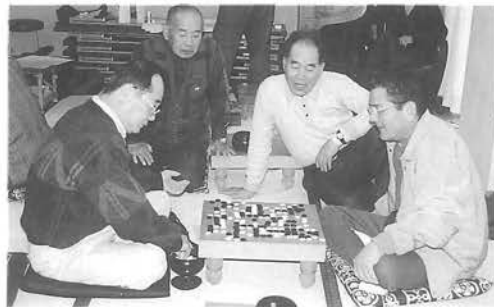
応援にも力が入ります