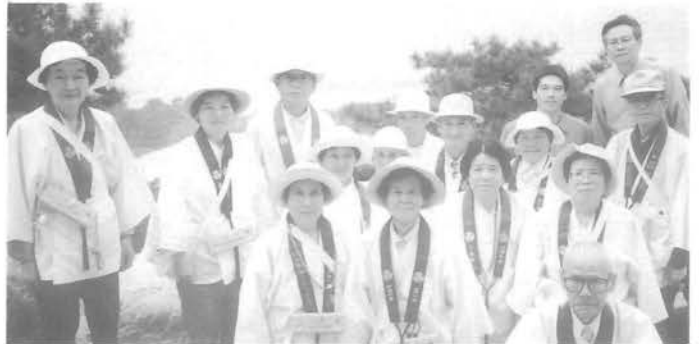
銭形砂絵を見学(観音寺)

第十三期お四国学級を、四月二十一日から二十三日までの二泊三日の日程で行いました。今回は第六十六番雲辺寺から結願寺大窪寺までの二十三ヶ寺を巡りました。今までは、一年に一回一つの県を巡拝し四年間で学級を行っていましたが、この組からは第一番霊山寺から順番に年二回学級を行って、三年目で八十八ヶ寺の研修を行い、後は高野山を残すのみとなりました。