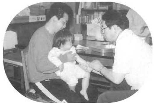
ツベルクリン反応検査