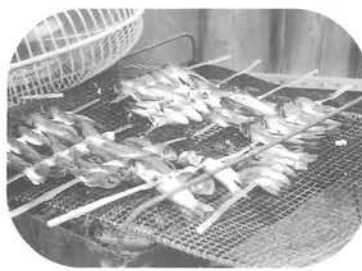
砂糖醤油で焼きました

達も帰省して、この日を楽しみにしています。このように何百年と続いている伝統行事を、これからも続けて欲しいものです。