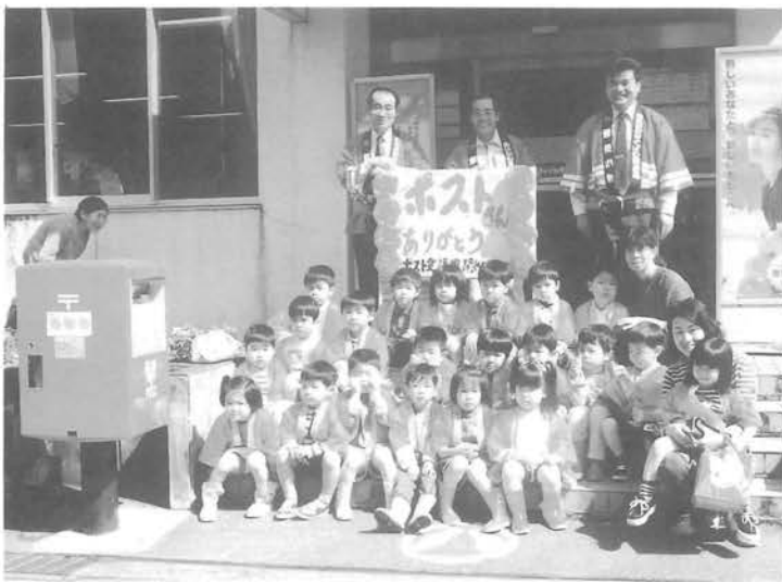
僕達、私達一生けん命やったよ

第三十六回ポスト愛護週間にちなみ、中野幼稚園児二十一人が、四月十七日、町内パレードとポストの清掃を行いました。ポストの色と同じ赤いハッピを着て、郵便局職員の人達と一緒に、鹿野川橋付近から郵便局前までを「ポストさんありがとう」の看板を掲げてパレードしました。ポスト清掃は、岩田シヨップ前と肱川郵便局前の二カ所を、雑巾できれいに磨いて、あらためて郵便ポストに親しみを感じていました。その後、郵便局長さんから、「きょうは、ポストをおそうじていただいて本当にありがとう。これからもポストを大切に使用して下さい。」とお礼の言葉をいただきました。園児達は、郵便局からもらった、おみやげを大事に持って、疲れもみせず元気に郵便局を後にしました。