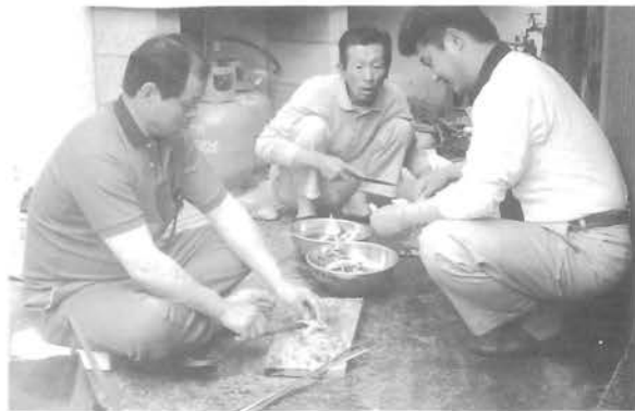
魚料理も手慣れたものです