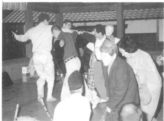
盆の舞に厄年の人が参加

中野にある三島神社で、四月十三日、鎮繩神楽が行われました。神楽が行われるようになったのは戦後からだと言いますが、厄落としが行われ始めたのは約十年ほど前から行われるようになったそうです。赤ちゃんの無病息災を祈って当日は雨にもかかわらず、氏子約六十人が参加、約四時間に渡り上演されました。本厄の人たちが、盆の舞等の神