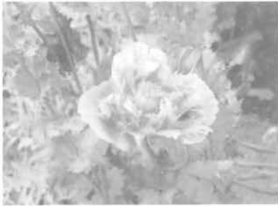
栽培できないけし(ソムニクエル種)