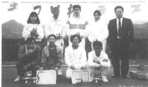
テニス大会で入賞された皆さん

のびウォーク、テニス大会等についてお知らせいたします。 今回で四回目のテニス大会には町内外から三十チームが参加して(町内四チーム)、混合ダブルス、トーナメント方式で試合が進められ午後三時まで熱戦が続きました。 なお三位までの成績は次のとおりでした。