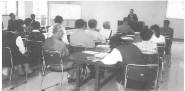
身体障害者厚生会 総会