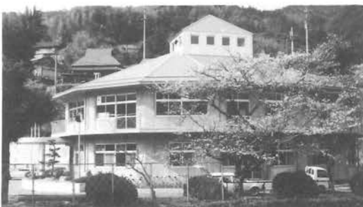
融資を受けている大谷小学校