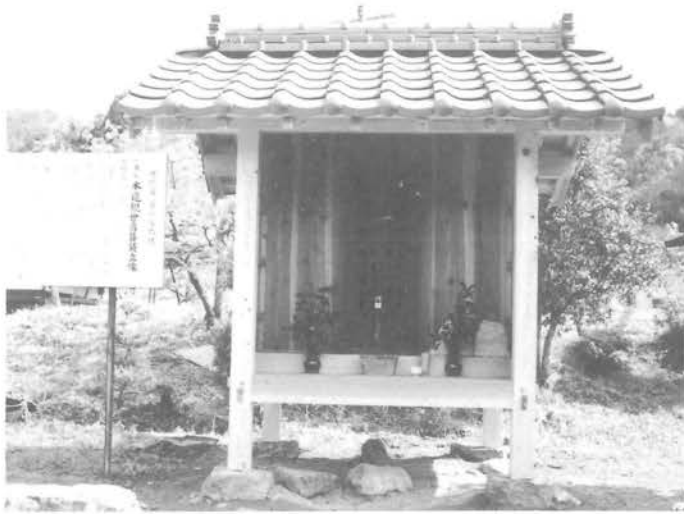
町指定有形文化財 木造観世音菩薩立像 (肱川町柳部落)

改築されたお堂に安置されているのは、檜材一木造りの観世音菩薩立像で、平安時代後期の作風を