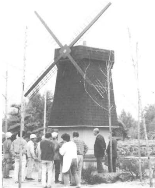
風の憩い公園に完成した風車

建物は、内部を六本の電柱で支えた六角形の木造です。外部はモルタル及びシングル瓦葺で高さが六メートル幅三・五メートルで和風公園の中にオランダの風車が仲間入りしました。