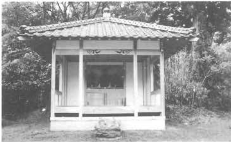
再建された阿弥陀堂

通称万願寺に再建された阿弥陀堂には、阿弥陀様と毘沙門天様が祭られています。もう一方の通称馬場ノナルに再建された大師堂には大師様が祭られており今でも地域外の方もお参りに