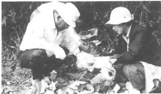
山菜採りを楽しまれる特別町民の皆さん

昼食交流会、歓迎アトラクションとして風陣太鼓が出演し参加者を楽せました。午後は丸山公園の満開のシャクナゲ観賞や歴史民俗資料館の見学、鹿野川園地の遊園など、思い思いの自由行動で過ごしました。自然がいっぱい、新緑がいっぱい、小脇には山菜がいっぱい。今年の特別町民の集いは大盛