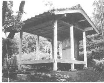
再建された大師堂