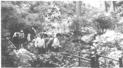
年々来客が多くなっている丸山公園

鹿野川しゃくなげまつりは、三月二十九日にダムえん堤下流の駐車場において開幕式が行われ、あわせて俳句碑二基の除幕式が行われ鹿鳴園・丸山公園・鹿野川園地を中心に四月二十九日まで開催されました。 期間中は町内外から多くの来客があり年々増加しています。 また期間中の土、日、祭日には大谷特産加工場が特産市を開き観光客から好評を得ていました。 主催の肱川町観光協会では、期間中いろいろな催しを計画し実行しましたが、今回はのび