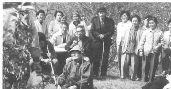
小藪老人クラブの皆さん(猿が滝)

一日を有意義に終わりました。今回は、今回見学出来なかった地区を見学勉強することに致しました。