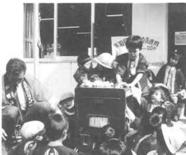
園児たちの手によりポストはピカピカに