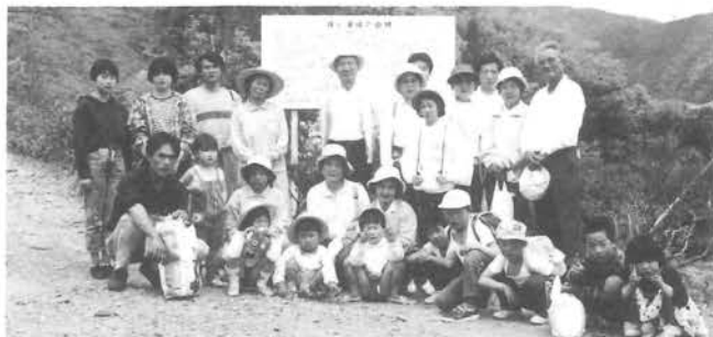
のびのびウォークの皆さん(猿が滝公園)

また、今回で四回目の「のびのびウォーク」は四月二十六日快晴の中参加者三十名が鹿鳴園に集合し、元気よく出発しました。