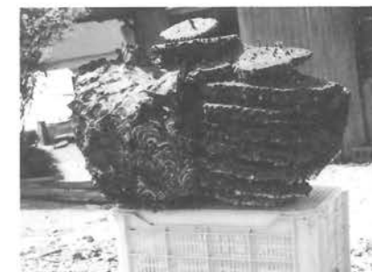
めずらしい双子のスズメバチの巣