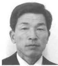
男 福泉 47歳 1回 左官業(共栄)

何も分からない、一年生ですが小さい、ことから、「一ツツ」、勉強し地域の皆様の対話を大切に、若さと実行力で、町民の為に一生懸命に頑張りますので、皆さん御指導をよろしくお願い申し上げます。