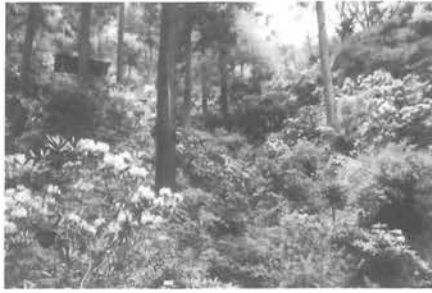
多くの方の目を楽しませた丸山公園