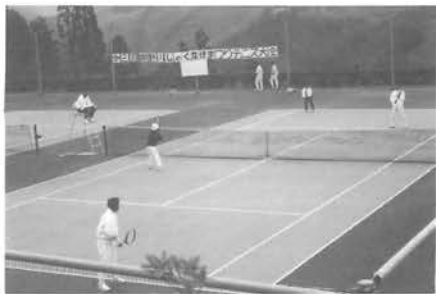
18チームが熱戦(鹿鳴園テニスコート)

今回初めて行われたグリーンアドベンチャー大会には、二十組・六十人の参加がありました。会場となった鹿野川園地には八ポイントにクイズが書かれた用紙が置かれており、参加者はこのクイズを解き次のポイントへと移動していました。なおこの大会の三等までには賞品が贈られました。 しゃくなげまつりテニス大会には町外から十八チームが参加