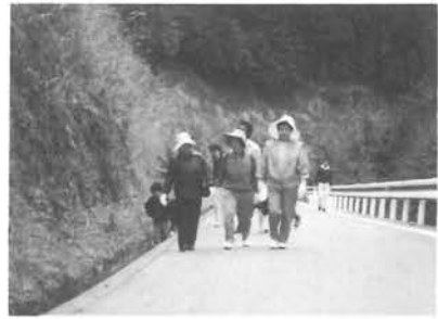
林道をのんびり散歩

鹿野川村線をのんびりと歩き、道路沿いの山菜狩りを楽しみながら岳山へ。昼食は鹿鳴園の庭におにぎりやアミノウオの塩焼きに舌づつみをうちながらの歓談、午後は、疲れた体を保養センターの温泉に入りのんびりされたりテニスの観戦などのコースで午後二時頃楽しい一日を過ごされ帰途につかれました。