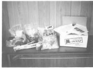
今回発送された品物

募集しておりますので、知人・友人・親戚等の方にぜひ加入をお勧めしてください。詳しいことは役場風おこし対策室までお願いします。