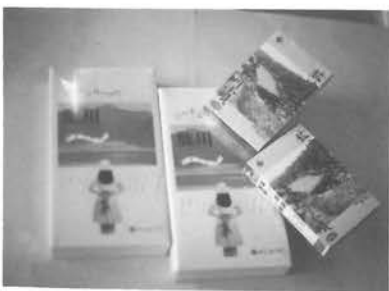
ビデオ・カセットテープ