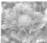
昨年、町内に多かつたけし(八重咲)

不正大麻やけしを発見した場合には役場か大洲保健所へ通報してください。また、大麻やけしについて分からないことがありますしたら大洲保健所又は町保健センターへお気軽にお問い合わせください。