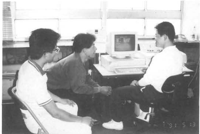
公民館図書室に設置のパソコン