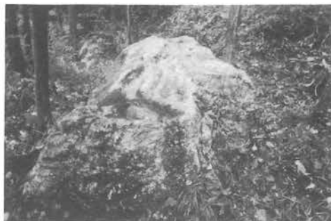
いつもくぼみには水がたまっているというイボ神様

直径三〇センチメートル、深さ二〇センチメートル程のくぼみがあり、いつも水が溜っています。この水はどんな日照りの年にも涸れたことがないそうです。地域の人々はイボができた時にはここにおまいりし、このくぼみの水でイボを洗います。するといつの間にかイボがなくなっているといえます。 また逆にこのくぼみの中のお賽銭を取ったりするとイボがでてくるともいふ伝えられています。 最近ではイボのでた人を見かけることがなくなり、おまいりする人もほとんどなくなりました。以前はこのイボ神様も田んぼの中でしたが、現在は杉木立の中でひっそりと座っています。