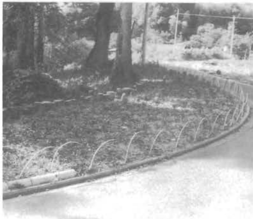
月の尾花の会花だん

種を蒔いて芽を出した時の苗は、その辺の雑草と少しも変わらないのに、丹精こめて育てているうち、蕾が出来、花を咲かす。庭を赤い花で、黄色い花でいっぱいにして思うと思える事ができる。