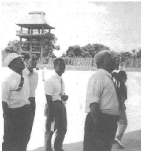
吉野ヶ里遺跡で 後ろは物見やぐら

続いて、佐賀県・神崎町と三田川町にまたがる、吉野ヶ里遺跡を見学しました。弥生時代の集落や