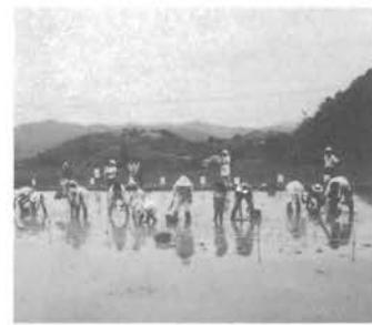
お母さんも子供も初めての田植え

都市と農村との交流事業の一環として、六月二十四日に農作業体験ツアーが行われました。 肱川町で募集したところ、当日は、松山市より、十一家族の親子三十七名の参加があり、藤之原の町所有の水田(ハール)で田植えを体験しました。