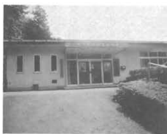
福祉対策の視点創作館

体制につきましては、昨年ホームヘルパー一名増員いたしております、県の指導にも合ったものであり一応整っておると考えております。今後については状況に応じて考えて参りたいと思っております。