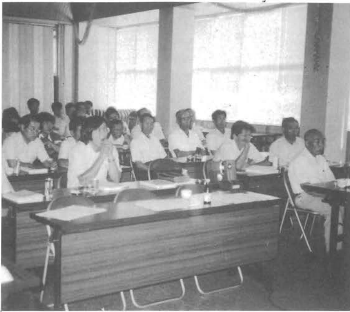
共済商品研修を受ける役職員

当農協の長期共済保有契約高は、今年三月末で、三百十九億二千万に達したが、「万一の場合の保障」や「不安のない老後保障」を約束するまでには至っていない。