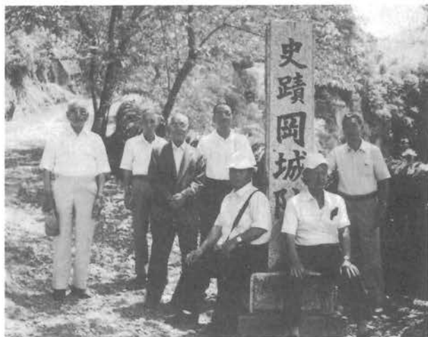
岡城跡で記念撮影