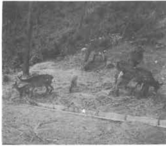
お母さん鹿とかわいい子鹿