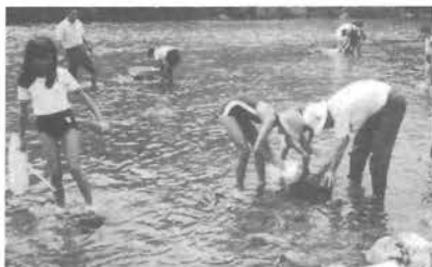
この石にはたくさんいるかな

地域住民にとって大切な肱川です。川に『ゴミ』等を捨てないで、いつまでもきれいな肱川にしたいものです。