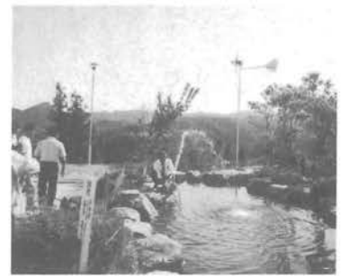
鹿鳴園に設置された風車と噴水

地域エネルギー開発利用発電可能性調査の中で風の博物館構想の方向づけが示されておりますが、町としてもそういうふうな取り組みをしたいという考えをもっておりますが、その中味をどうするか、こういったことを本年度一年をかけて煮つめたいと思っております。