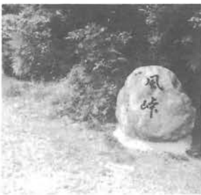
峠に建立した石碑

最初の事業として標高四七〇mの風峠に建立したものです。 この峠には往来するため昔の住還が残っていますが、今では道路が整備されこの旧道を通る人もほとんどなくなりました。昔はこの峠を多くの人々が往來し文化の交流に役立っていたことでしょう。