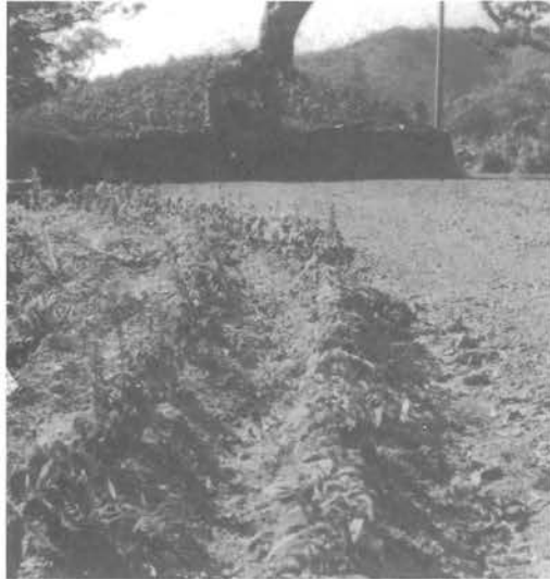
上森山花の会花だん

公民館の掲示黒板に書かれている六月の詩です。もう皆さん方の中には、読まれた方も多いことと思います。人と花の心を、ずばりうたった素晴らしい詩だと思えます。