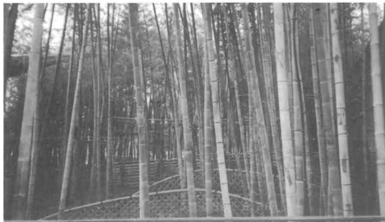
“肱川町のモウソウチク”の晴れ舞台！ 国際花と緑の博覧会(大阪), 政府苑にて

去る、六月二十五日から二十七日まで肱川森林組合労務班研修旅行に同行させてもらい、大阪で開催されている国際花と緑の博覧会へ行ってきました。例年は、どこぞへ釣りに行っていたのですが、今年は肱川町のモウソウチクが博覧会に出場している為、肱川町の竹が元気にしているかどうか、ちょっと見に行ってきたわけです。さて、目の前に竹の生い茂った光景を思い浮かべてみてください。ほとんどの方が、竹ヤブという言葉葉を思い浮かべるだけで竹林とは思いつかないでしょう。日本人とか人類の悪い習慣で空気とか水などのように生活に欠くことのできないものでありながら身近どころか密接にありすぎるためか粗末に扱ってきました。竹も林でなくヤブ扱いです。竹は山崩れ、堤防決壊に強く、騒音や大気汚染防止の役割もする。地震の時の安全な逃げ場といえ、に竹林です。しかし、現状はというと宅地や工場用地に変わっていったり、生活用品としての竹の効用も広いのに科学製品に押され出番が少ない。竹の美しさ、素材さをえがいた絵や歌も心なしか見当たらないような気がしません