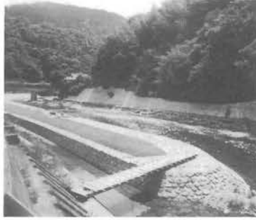
63年度より整備されてきた河辺川

の下から河辺川橋の間で、六十三年度三三八メートル、元年度三二八メートル、二年度四二〇メートル、工事費総額二億七、五〇〇万円となっております。 対岸へ渡る施設につきましては飛石的なものをご考えております。落石防止につきましては