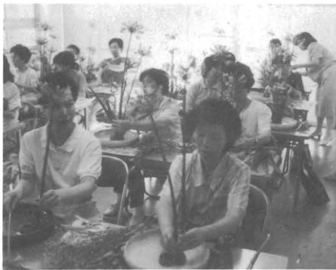
みんな上手に生けました

の材料は全員同じなのですが、花の曲がり具合や生ける人によってそれぞれに違いがあり、お互いに鑑賞し合いました。今後、水盤に生けるだけでなくつぼ生けも行う予定です。 公民館では花いっぱい活動を展開しているところですが、家の中にも花を飾り心にうるおいをもちたいものです。