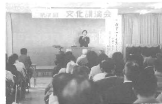
まばたき(1秒)の重さ

『まばたき』の人生であるのに私達日本人は、いつもみんなと一緒に、手をとり合って、自分を殺して、自分を犠牲にして、しかも自己規制して、いつも一致団結して、仲間はずれに合わないようにして、人の顔色を見ながら、なるべく自分のことをしゃべらないようにして、同じ方向にむかい、何となくみんなと一緒に歩くのが得意なんです。たとえ、みんなが右に行っても私は左だと思っても、誰も左にいなかったら、ああいやだよっばりみんなと一緒に行こうというふうに思いがちなんです。だからこそ、よい製品が生まれ、国力がこんなにも充実して、国が発展を上げたわけです。だから私はそれを否定しているのではないけれど、私達個人個人の歩む人生は『まばたき』の人生なんです。その『まばたき』を歩く上で、何となく自分を殺して、みんなと同じ方向むいて、考えもしないで歩いてきてしまう。いずれ私の人生ってどこに行っただろう。私は何だったんだろうかと思う日が来てしまふんじゃないかと考えてしまふのです。