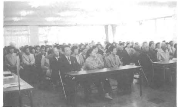
思った時がスタート...

ある時、アナウンサーが野球中継の時、コマージュルへ入るためのセリフを忘れていた。ハッと気がついてそのセリフを言ったところが、スポンサーの名前をまちがえて言ってしまった。直そうとして、さらにまちがってしまった。急いでいる時、からんだ糸をほぐそうとして、あわてるとますますこんがらがらる。あれと同じで、正確に言い直そうとするんだけど、あせるから思えば思うほど深みにハマっていくということなんです。ただ、今日のテーマの第一段階がここにあるんです。人間感じるか感じないか、人間意識があるかないかが第一段階なんです。つまり、キャリアを積んだベテランであるほど経験があるので、何かいつもと違うぞとか何か人を傷つけたんではないかなと感じるものがあるわけなんです。人生経験の浅い人はどうやって自分が人を傷つけたのか、どこが違うのか、気づかないで通り過ぎて行ってしまふんです。まず意識があるのかわからないのかというのが第一段階です。