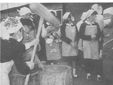
収穫のよろこびを皆んなで味わいました

― 肱川町福祉基金へ寄附 ― ○愛媛南部ヤクルト販売株 ありがとうございました。