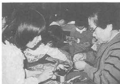
裁縫ってむつかしいんだな (お手玉づくり)

内容は、感謝の作文、子供との話し合い、昔の話、昔のおもちゃ作り等で、終始なごやかで楽しい、有意義な会となりました。