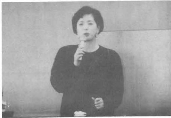
自分らしく生きる…

アナウンサーの仕事はおわかりだと思いますが、大勢のみなさんがご存知ない、気づいていないことがあります。その気づいていない仕事は民間アナウンサーの第一歩であって終着点であります。あえて民間放送といったのはNHKのアナウンサーは一生涯経験することのない仕事。つまり民間放送だから、企業からお金をもらって、予算を組んで放送がなされるわけです。その企業を我々はスポンサーと呼んでいます。スポンサーあつての民間放送だから、番組の