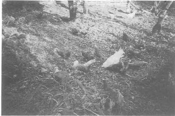
まったく自然の中で自由奔放（皆農塾）

都会の生活は沢山稼いで沢山使う生活だった。地方の生活が同じ目論みでは都会の思想・論理に押しつぶされてしまうのは当然である。都会が沢山稼いで沢山使う形態ならば、農村は少し稼いで少し使う形態を選択すべきである。その少し稼いで少し使う形態の中に確固たる思想がないと都会の欲望の大河の前に農村などひとたまりもない。