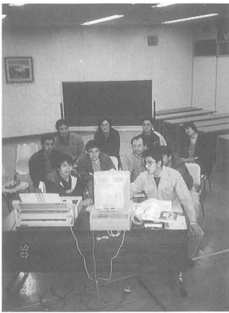
将来の営農に必ず役立ちます