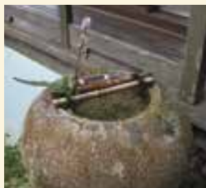
臥龍山荘不老庵にある水鉢

タブレット端末などを使ったりリモートでの交流会や商談会などの取材も多くなりました。最近、コンピュータネットワーク中に構築された現実世界と異なる仮想空間や、そのサービスを指す「メタバース」という言葉を聞きます。映画のようにアバター（分身）を作って仮想空間の世界でイベントに参加したり、交流できるようになるそうなので、興味深く感じています。