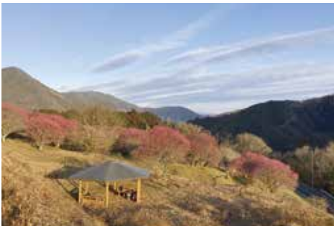
大洲家族旅行村の紅梅 (1月30日(日)撮影)