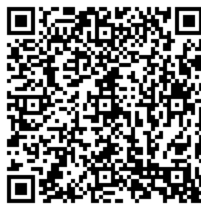
←ふるさとチョイス