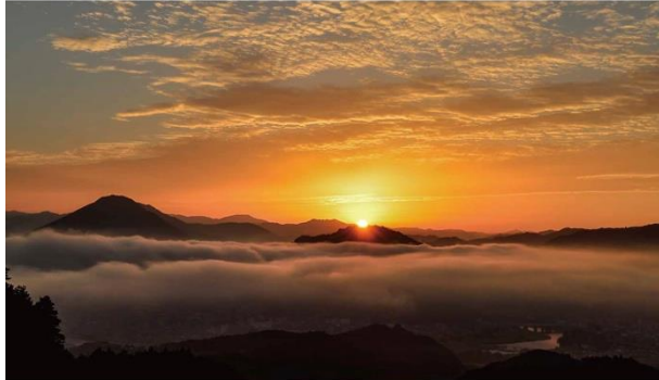
きらめくおおず ～みんな輝く肱川流域のまち～