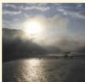
新長浜大橋から見える朝日

成人式では、新成人のみなさんが久しぶりの再会を喜んでいました。私も4年前の成人式で、「新しい自分になるため、目標を持って人生を歩む」を胸に刻んだことを思い出しました。