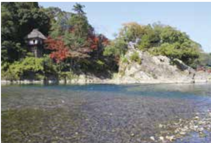
臥龍山荘不老庵と蓬萊山 (11月20日(土)撮影)