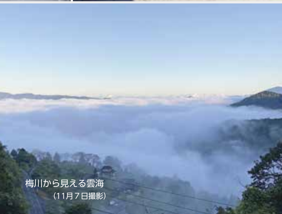
梅川から見える雲海 (11月7日撮影)