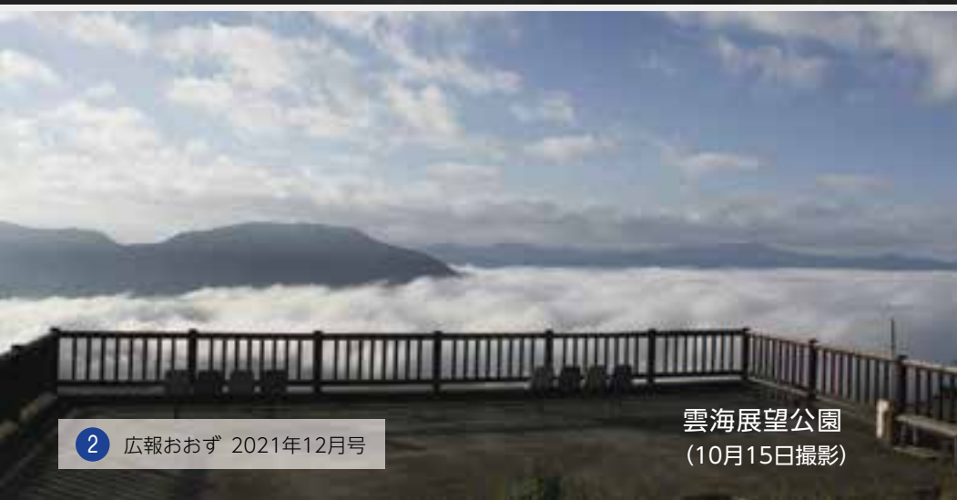
雲海展望公園 (10月15日撮影)