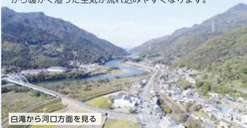
白滝から河口方面を見る