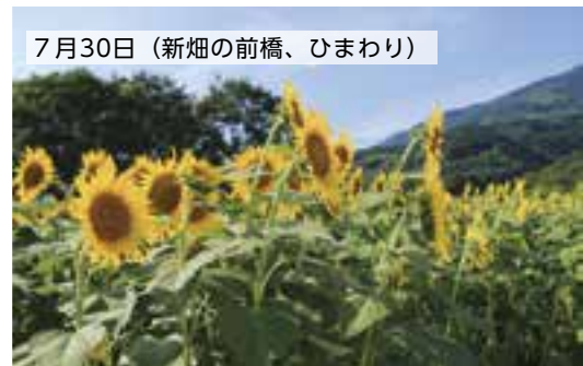
7月30日（新畑の前橋、ひまわり）