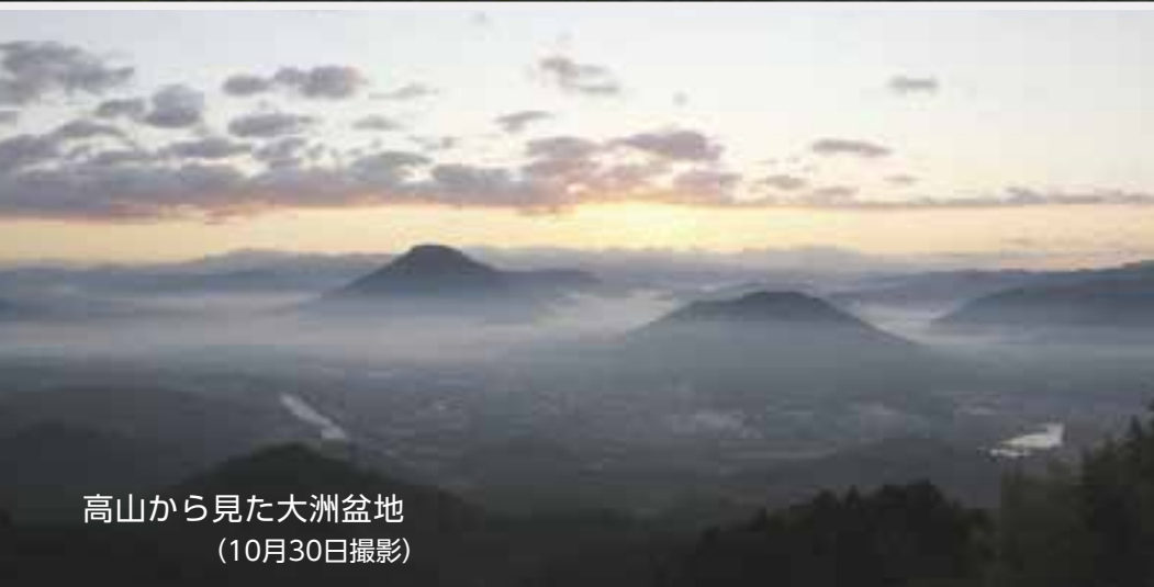
高山から見た大洲盆地 (10月30日撮影)