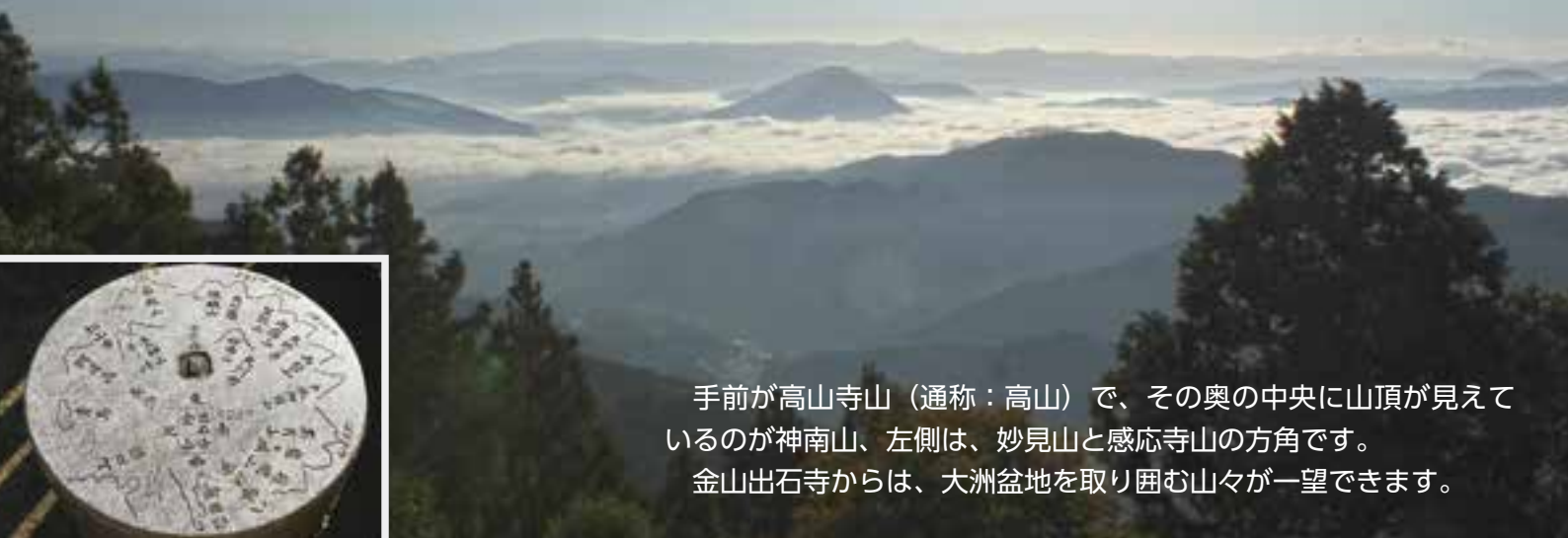
金山出石寺から見える雲海 (10月9日撮影)