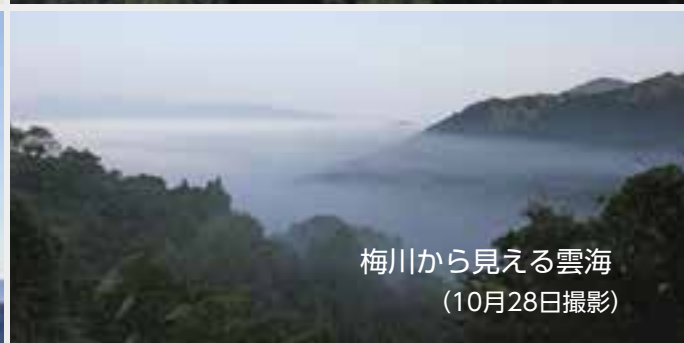
梅川から見える雲海 (10月28日撮影)