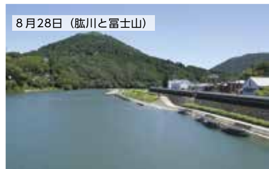
8月28日（肱川と富士山）