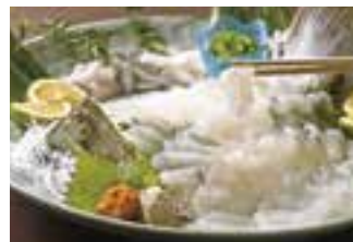
【日出町】 城下かれい