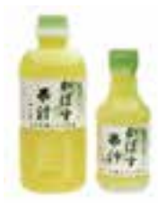
【臼杵市】 かぼす果汁100%