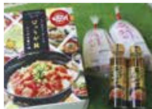
【津久見市】 おうちでひゅうが丼セット