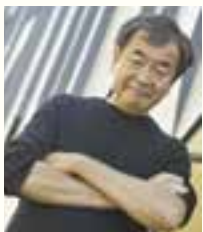
くまけんご 隈研吾さん(建築家、東京大学特別教授・名誉教授)