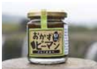
【豊後大野市】 おかずピーマン