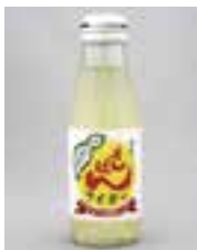
【別府市】 別府ざぼんサイダー