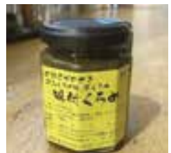
【大分市】 味付くろめ