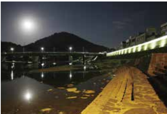
肱川の夜景（10月23日(土)撮影）