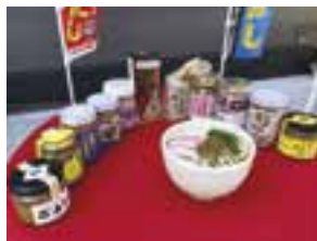
【佐伯市】 佐伯ごまだし