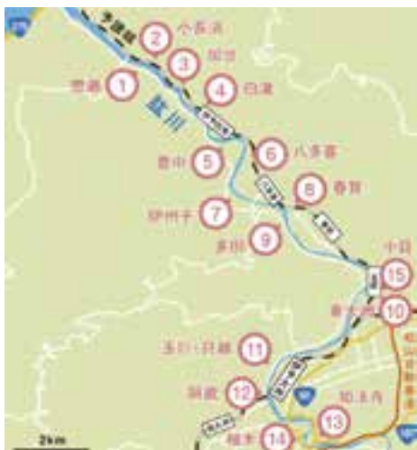
位置図 直轄事業実施区間L=6.9km

平成30年7月豪雨を受け、国土交通省では、愛媛県・大洲市と連携し、再度災害防止のため、激特事業により全15地区で堤防工事を進めています。激特事業は、大雨により河川の水位が上昇しても、安全に水が流れるように堤防整備することが主な内容です。令和5年度の完了を目指しています。