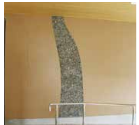
全校児童が河原で集めた石を張り付けた脇川をイメージした外壁