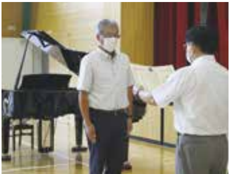
グランドピアノを寄贈していただいた八多喜地区教育振興会に感謝状を贈呈しました。

設備面でもオストメイト対応でベビーチェア・ベビシートを設置した多目的トイレや、LED照明、太陽光発電・蓄電池を整備し、防災や環境面に配慮した施設になっています。