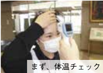
まず、体温チェック