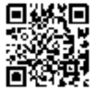
ジョブカフェ愛workホームページ

ジョブカフェ愛work 松山市湊町4丁目8-13 ☎089(913)8686 FAX089(913)8685