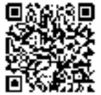
愛媛朝日テレビホームページ