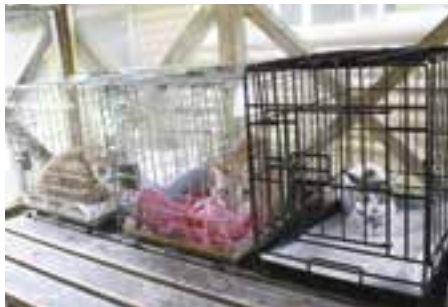
6月20日(日)開催の「ぬくもり市（保護ネコ&イヌ譲渡会）」で撮影

野良猫が増える原因は、人間の勝手な都合で捨てたり、かわいそうだからと思って置きエサをすることです。