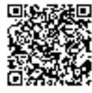
四国電力送配電ホームページ