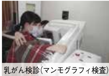
乳がん検診(マンモグラフィ検査)

当日は、保険証や送られた問診票などを忘れずに持ってきてください。 ※健診は申し込み制です。