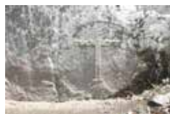
▲寺小路磨崖クルス