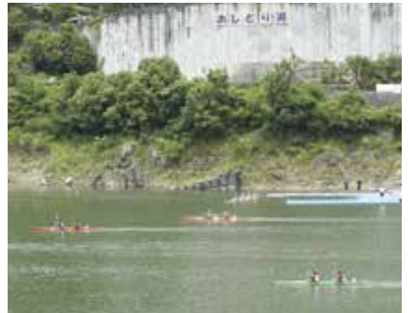
四国4県から12校、76人の選手がおしどり湖で熱い戦いを繰り広げていました。