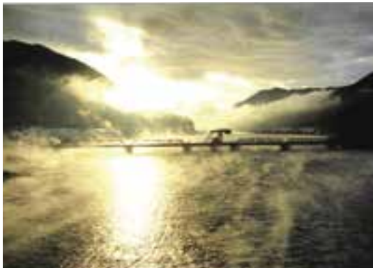
「黄金の朝」

〒799-1340 大洲市長浜甲480番地の3 大洲市役所長浜支所内 肱川あらし実行委員会 ☎021111