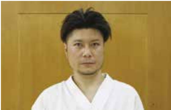
伝統派空手道教室 糸東会社風館